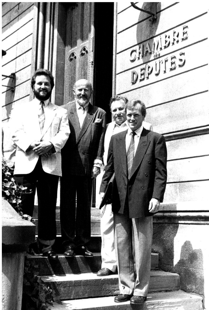
1989: Den Aktiounskomitee mat véier Deputéierten op der Chambertrap

De Referendum: Et ass e Kapitel e bëssen à part, well de Meritt vu sengem Ausgang net just der ADR gehéiert. Duerfir kritt dëse Walgang iwwert d'Zukunft vum Land och en eegent Kapitel.