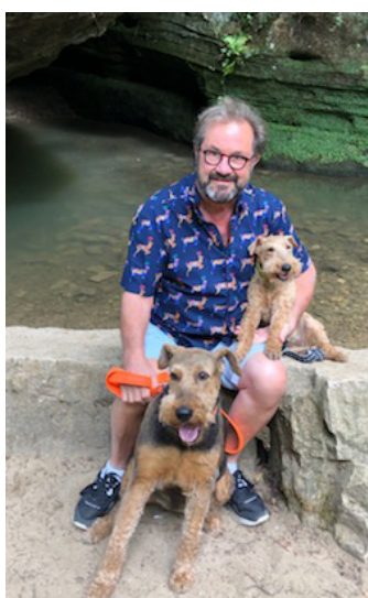
Zwee, déi ee kënnen op Trapp halen ...

Relax huet een de Gast eigentlech seelen erlieft. Dat erkläert och, datt déi nei Geloossenheet, déi hie weist, zënter datt den Dag vu senger Pensioun publik ass, engem esou opfällt.