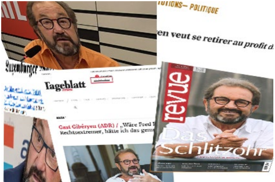
De Gast an d'Press: net nëmmen eng grouss Léift.

E Mann, deen esou an der Ëffentlechkeet steet, huet noutgedronge méi en enkt Verhältnes zu der Press. D'geschriwwen a geschwate Press ass wichteg, fir seng Meenung ënnert d'Leit ze bréngen. An och wann de Gast iwwert d'Joren ëmmer nees gutt a positiv Artikelen hat a wann hien als dankbaren Interview-Partner a Pointen-Liwwerant behandelt ginn ass, war dëst Verhältnes net ëmmer harmonesch.