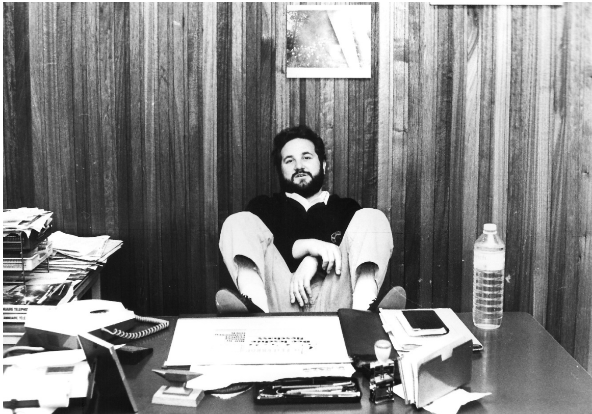
Féiss op den Dësch leeë war als NGL-President héchstens eng Optioun fir de Fotograf.

Geschwë war hien haaptberufflech bei der Gewerkschaft a gouf Generalsekretär vum NGL an duerno 1989 och President. Hien ass bei der NGL och zum Éirepresident ernannt ginn.