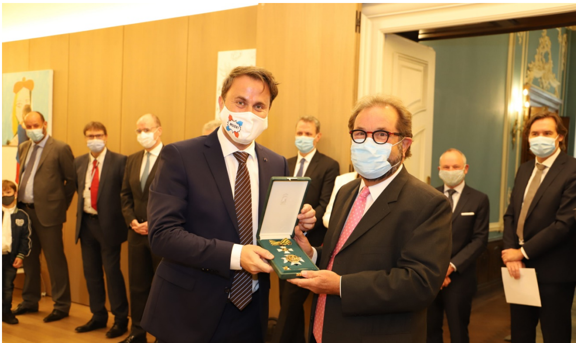
Eng Medail fir dem Gast Gibéryen seng Verdéngschter. D'Corona-Mask satiresch als Maulkuerf ze gesinn, wär eng typesch vum Gast.

D'Popularitéit vum ADR-Deputéierte besteet och an deem Ausdeelen. Beileiwen ass d'Politik net mat der nobeler Konscht vum Boxen ze vergläichen – well hei heescht Ausdeelen net ëmmer fair no strenge Reegelen ze kämpfen. Mee Popularitéit erreecht