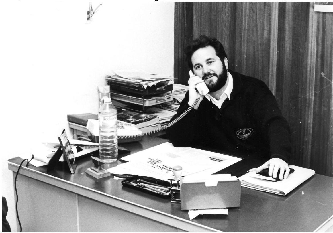
Den Telefon huet d'Feil beim Schaffgeschier ersat.

Leider gëtt haut vill ze dacks behaupt, nëmme mat engem akadeemesche Grad kéint ee komplex Aufgabe léisen. Mee och mam A a mat der Hand vum Handwierker kann ee Léisunge fannen a liwweren. Esou e Politiker war de Gast. Hien ass haut nach houfreg op seng Handwierksausbildung, an dës huet him ëmmer d'Instrumenter geliwwert, fir och komplex Problemer ze verstoen a Léisungen ze fannen.