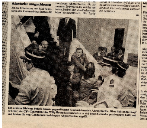
Trapebesetzung a sauer Reaktiounen 1989

De Grondsteen vun enger nationaler politescher Karriär war fir de Gast Gibéryen de Kampf fir eng méi gerecht Verdeelung vun de Renten. D'Gewerkschaften a Partee waren net frou iwwert deen neie Fuuss an hirem Revéier, dee Gewerkschaftler a Buergermeeschter vun enger klenger Randgemeng, där hir Wichtigkeet fir vill Leit just dra bestanen huet, datt si um Wee vum Sonndesausflug op d'Musel ëmmer Stau produzéiert huet.