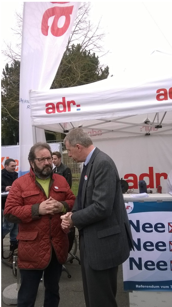
Kampagne fir den dräifachen Nee beim Referendum, hei zu Nouspelt op der Eemaischen.

Asaz goen, och wa si do net konnte mat finanzieller Ënnerstëtzung rechnen, wéi bei enger normaler Walkampagne. An deene puer Minutten um Krautmaart ass d’Kampagne vum „3x Nee“ gebuer ginn, e Slogan, deem der Meenung vun enger grousser Majoritéit vu Lëtzebuerger entsprach huet. D’Affichë fir d’Kampagne stoungen dem Gast an där kuerzer Zäit scho quasi an d’Ae geschriwwen.