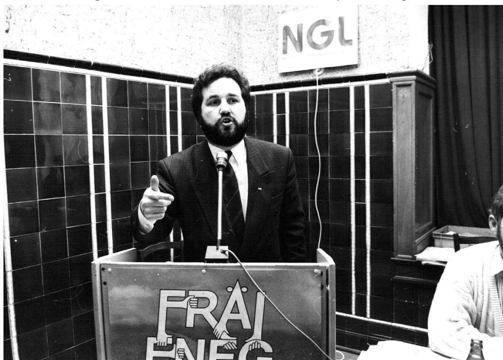
E jonken opstriedende Gewerkschaftler: Léierjore fir d'Politik.

Eng grouss Spillwiss. Ob de Gast wousst, datt hien hei gewässer moosse géing fir eng politesch Karriär trainéieren? Et huet op alle Fall scho Fangerspëtzegefäll a vill Vermëttlerkonscht gebraucht, fir hei vun all Mënsch akzeptéiert ze ginn. Hei schonn huet