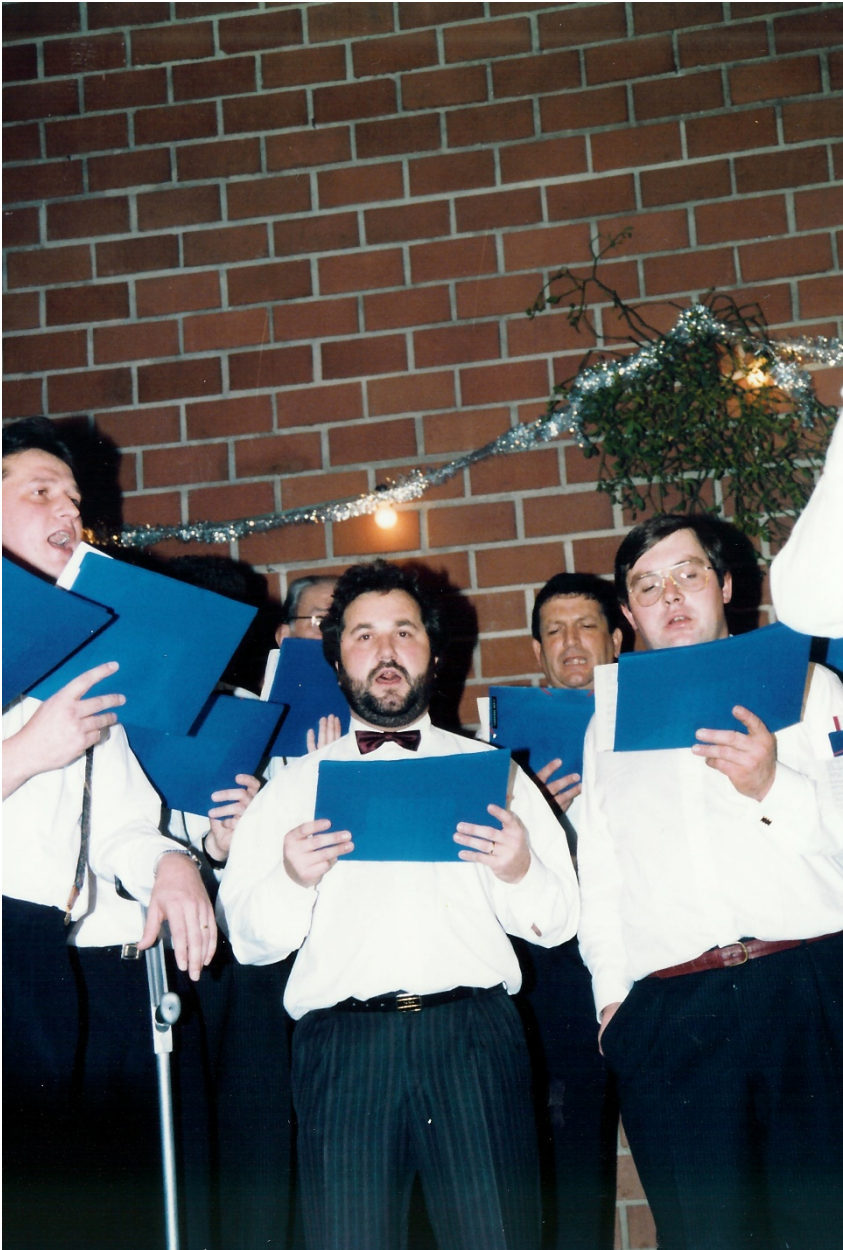
Freed un de Leit, Freed um Gesang ... an um gesellege Liewen.

eigentlech e Widdersproch, well d'ganzt Land kennt de Gast. Vlächicht gëtt et och an anere Parteie Leit, déi esou bekannt si wéi hien, mee et gëtt warscheinlech kee Politiker, deem d'Leit sech esou gär an esou séier uvertrauen.