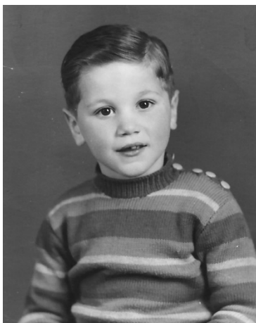
Dem Gast seng Kannerwelt war eng ganz aner wéi haut.

D'Leit hu sech nach besser kannt, a sief et nëmmen, well si alles, wat si gebraucht hunn, nach an hirem Duerf kafe konnten an do an d'Gespréich komm sinn, a well de Bistro vum Duerf d'Zentrum vum Liewen no der Aarbecht war. D'Gespréicher waren op Lëtzebuergesch, well d'Fro, eng aner Sprooch ze schwätzen, sech iwweehaupt nach net gestallt huet.