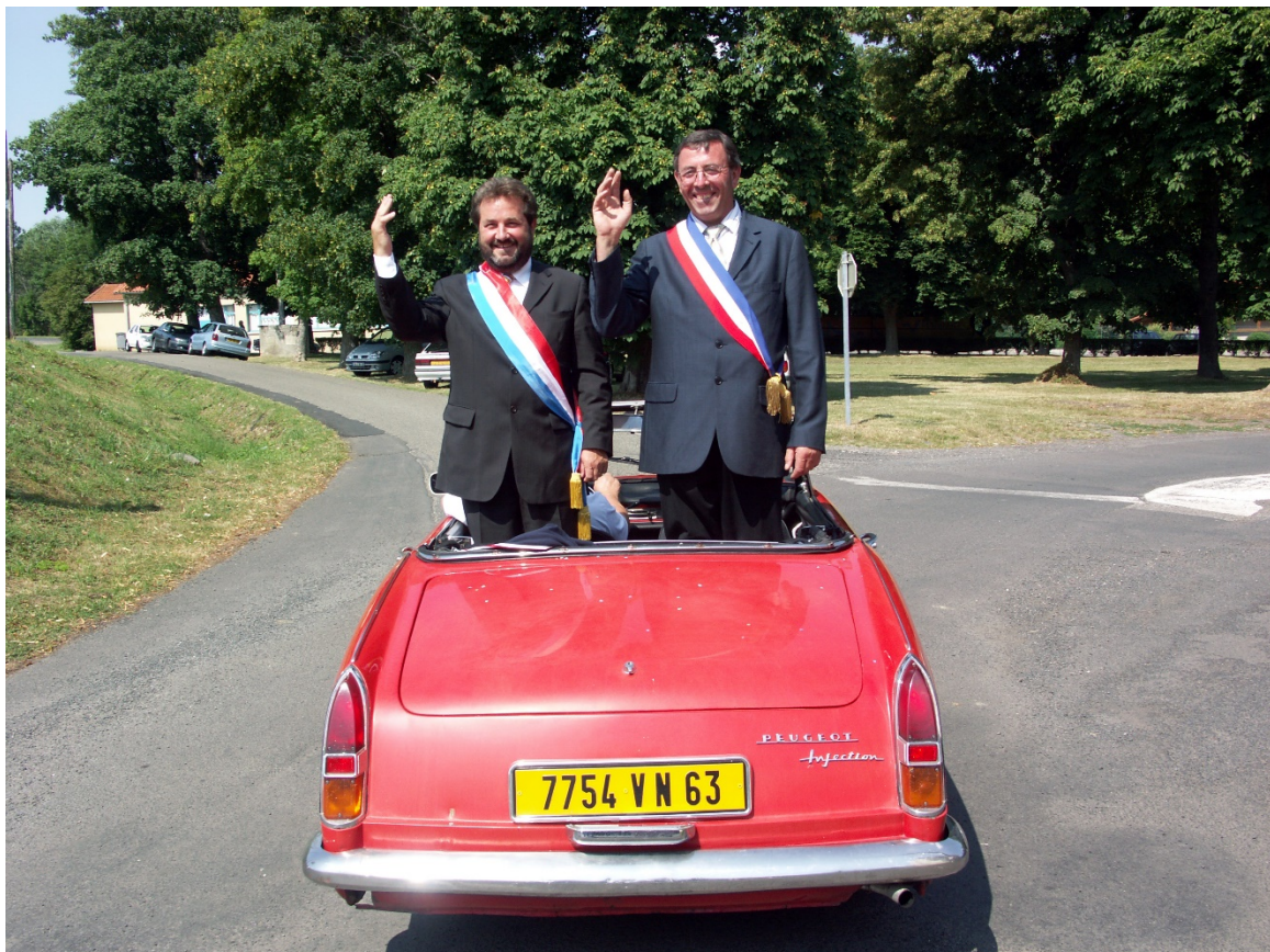
Politik: Handwierk, Talent an och e bësse Show.

Esou wéi en Handwierksbetrib gëtt och d'Partei gemooss drun, wéi laang si besteet a Succès huet. An och an deem Verglach schneit d'ADR net schlecht of.