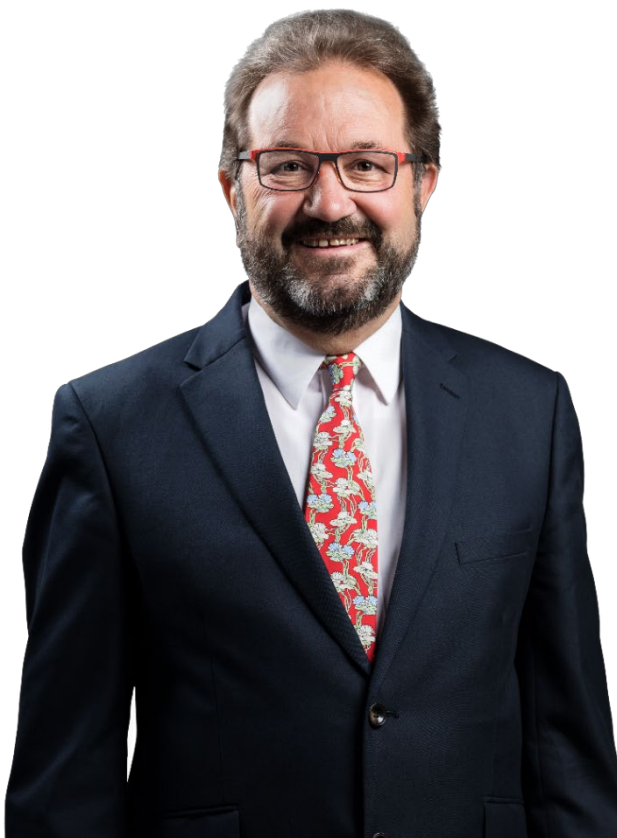
Eng leschte Kéier: Offizielle Portrait fir d'Nationalwalen.

2020 De Gast Gibéryen gëtt um Nationalkongress den 11. Oktober 2020 zu Ettelbréck Éirepresident vun der ADR. Zweek Deeg drop hält hien d'Pensioun.