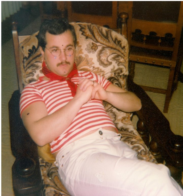
Mat 30 Joer fir d'Fuesend verkleet: Theatralik a Show gehéieren och zum Politikerberuff.

An der Politik konnt hien e gewëssent schauspillerescht Talent erausloossen, well zu enger gudder Ried gehéiert och déi entspriechend Gestik a Kierperhaltung. Et ass ganz beandrockend, wéi de Gast am direkte Gespréich esouguer seng Kierpergréisst asetzt fir iwwerzeegend ze wierken. Wann hien lech ganz no kënnt, fir säi Punkt duerzeleeën,