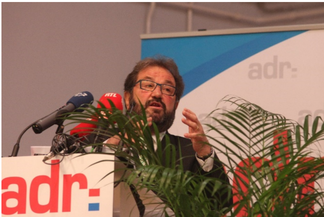
Iddien hunn a si verrieden ... wéi hei d'Wuesstems-Gedanken zu Gilsdrëff

D'sozial Ausriichtung vun der Partei an d'Suerg ëm déi, déi manner an der Pai hunn, ass e roude Fuedem am Gast senge Rieden. D'Elteregeld, dat d'ADR proposéiert, fousst op deenen Iwwerzeegungen. Den Usaz ass ganz spontan vum Gast geholl ginn, a wéi den éischte Projet parteiintern diskutéiert ginn ass, war relativ séier kloer, datt net vill misst