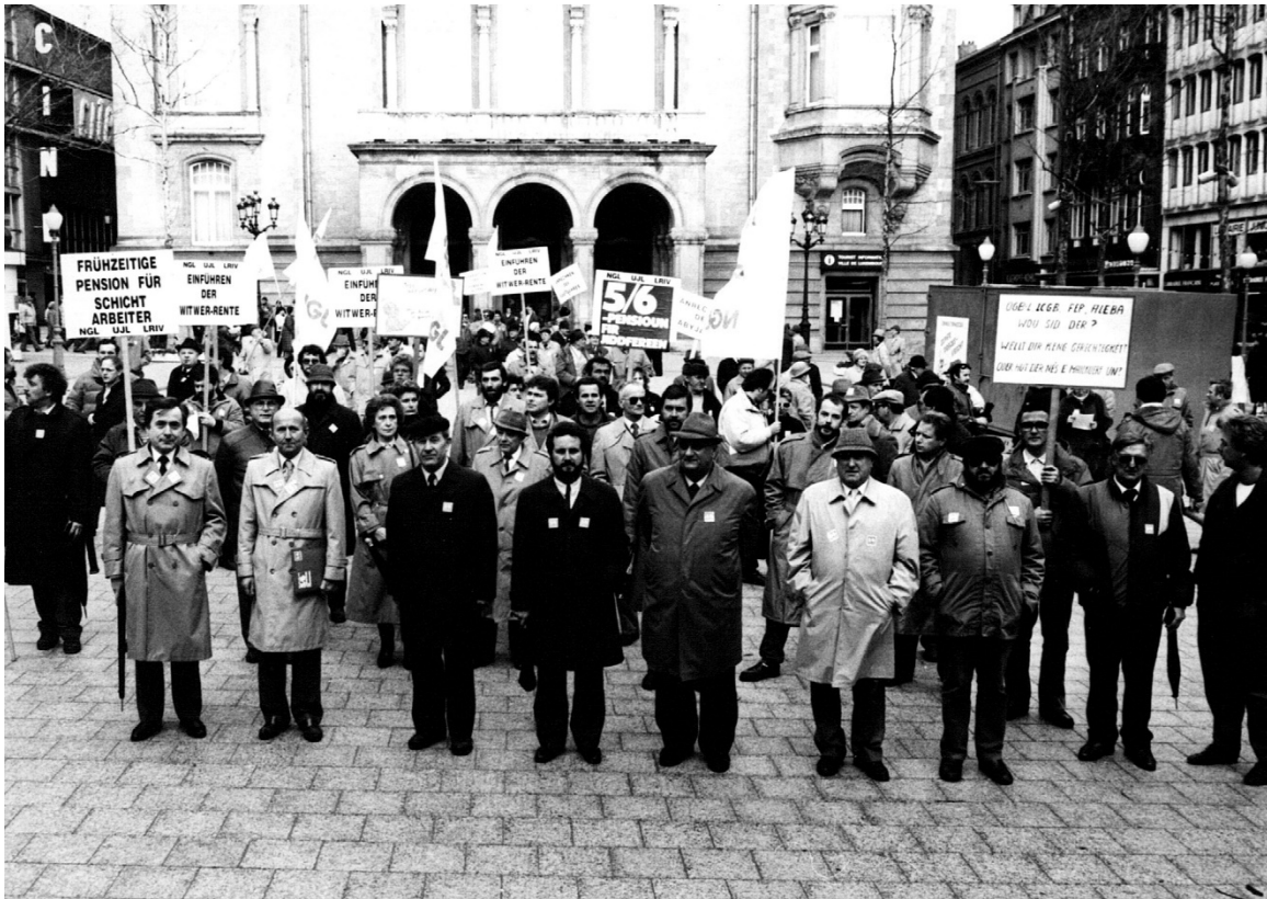
Manifestatioun fir Rentegerechtigkeit am März 1987: den Ufank net nëmme vun enger nationaler politescher Karriär.

Et ass op alle Fall eng gutt Äntwert op déi Remark, déi an Zesammenhang mam Gast Gibéryen ëmmer nees a vun alle Säiten ze héieren ass: „An enger anerer Partei wär hie bestëmmt Minister ginn.“ Vläicht ass dat eppes, wat a schwéiere Stonnen an him gewullt huet. Mee réckbléckend kann de Gast a senge leschten Interviewen doriwwer eigentlech nëmme laachen. Hien huet säint gemaach a vill vu sengen Iddie realiséiert an zum politesche Programm gemaach, déi an enger anerer Partei wuel jorelaang diskutéiert a verwässert gi wäeren. Politik huet och mat deem Idealismus ze dinn, eegenen Iddie wëllen eng Chance ze ginn. Wann dann de Wieler anescht decidéiert, liewen dës Iddien op d'mannst am Parteiprogramm weider.