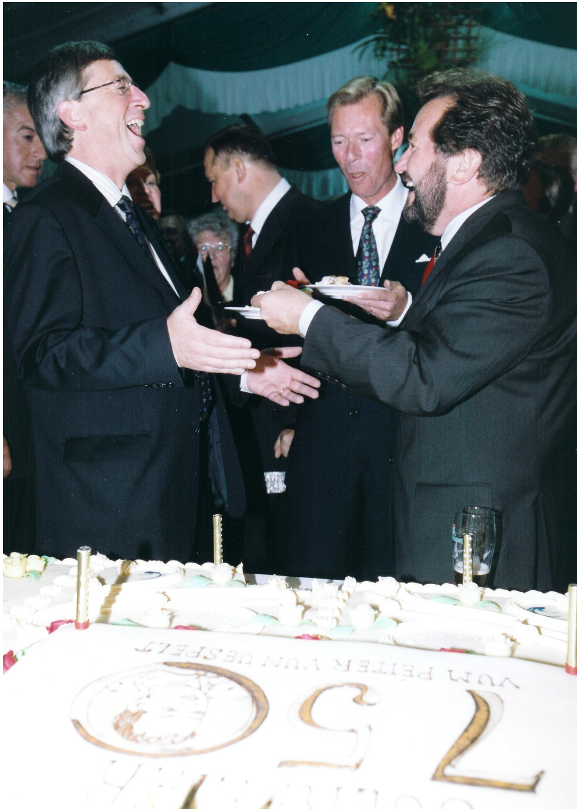
2003 op der Grënnungsfeier vun Uespelt (750 Joer Péiter vun Uespelt) nëmme frou Gesichter.

Gemeng schaffen, während am private Secteur vill méi Leit sinn, déi d'Nationalitéit net hunn an hir demokratesch Rechter an deene Länner ausüben, wou si hierkommen.