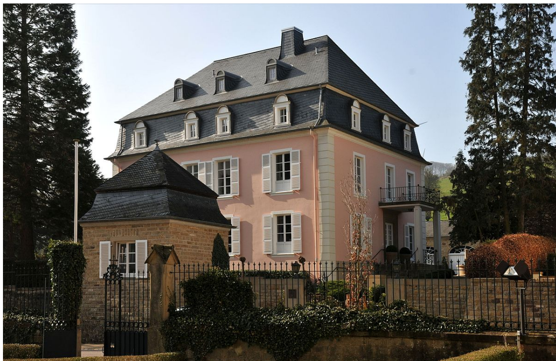
Bur: Hei huet de Gast seng fréi Kandheet verbruecht.

Bleiwe mer nach e bëssen am Bauerenduerf Fréiseng. Wa mer haut der aler Bausubstanz, déi an den Dierfer ofgerappt gëtt, nokräischen, den Zoustänn vun den Dierfer nom Krich kräischt sécher keen no. Lëtzebuerg war virum Krich trotz dem industrielle Süde kee räicht Land an nach staark vu Landwirtschaft geprägt. Dat huet sech duerno och