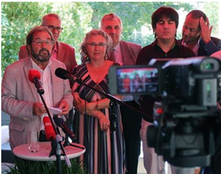
Eng Kamera an e Mikro: D'Presseiesse vun der ADR war eng vum Gast senge léifsten Übungen.