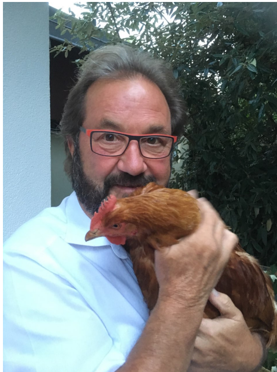
Wou dat hei hier ass, sinn der nach e puer.

Zwee och am Alter nach zimmlech wibbeleg Hënn passe bei de Meeschter wéi d'Fauscht op d'A. Geet dat duer? Nee, an de leschte Méint ass nach eng Hickecht Hénger op Fréiseng geplënnert, an déi halen hie schonn eleng waarm, well si fläisseg hir Eeër leeën an all Dag musse versuergt ginn.