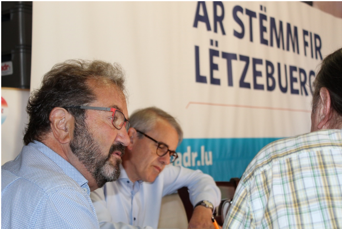
Iddien hunn heescht och ..., si an der Partei ze diskutieren.

Mee all Statec-Recherchen an den Zuele vum Land hu rout Fändele gewisen, wann ee si vun dësem Standpunkt gekuckt huet. Et huet ee just mussen drop kommen, deen Thema, deen net nei war an der Lëtzebuerger Politik, nach eemol opzegräifen. Dat ass um ADR-Nationalkongress zu Gilsdref geschitt. Nom Gast senger Ried war scho kloer, wat géing de Nationalwahlen 2018 de Stempel opdrécken. Eng Thematik zu där och d'Wunnengsnout gehéiert – déi och aus deem séieren an onkontrolléierte Wuesstem vu Lëtzebuerg entstanen ass – an déi en eminent soziale Problem ass.