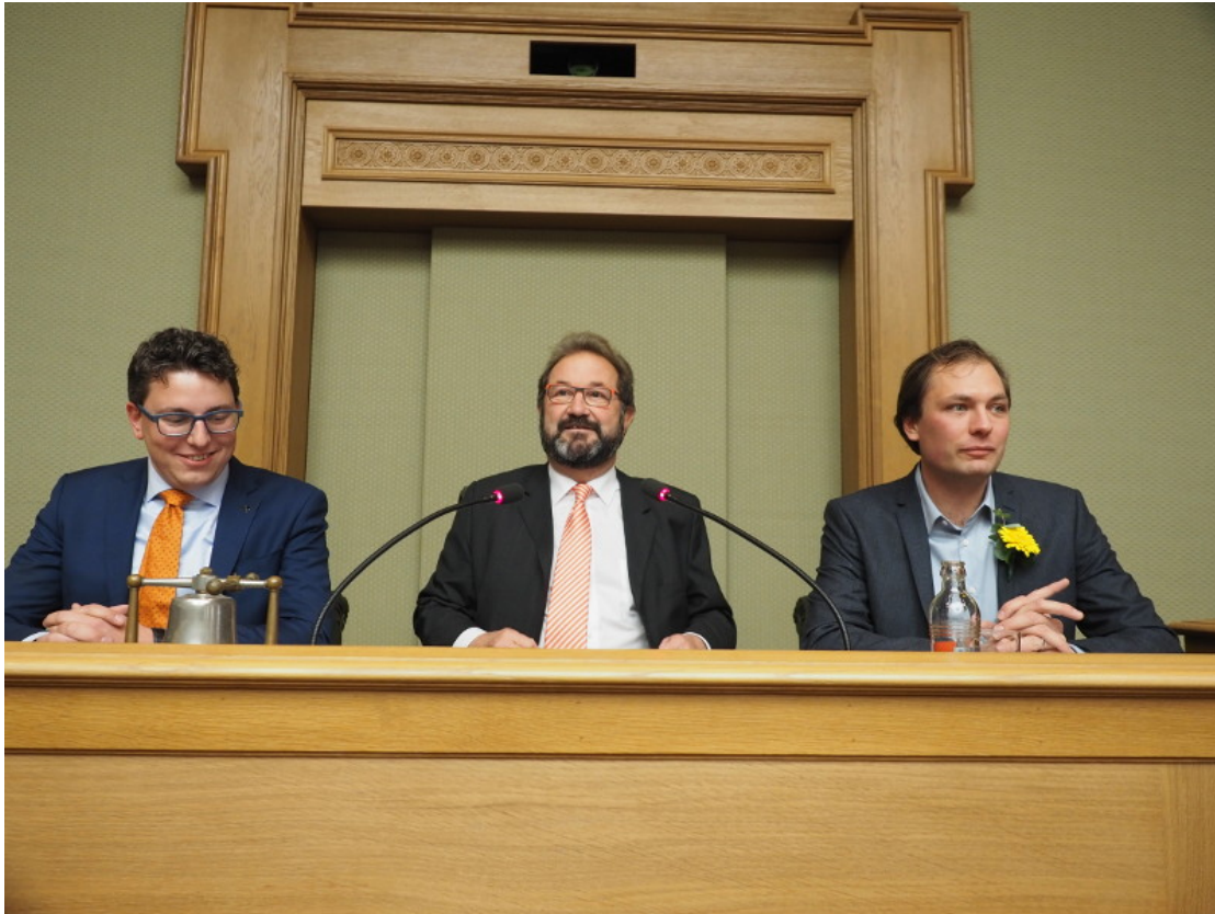
Éischte Bierger vum Land: De Gast 2018 als Chamberpresident.