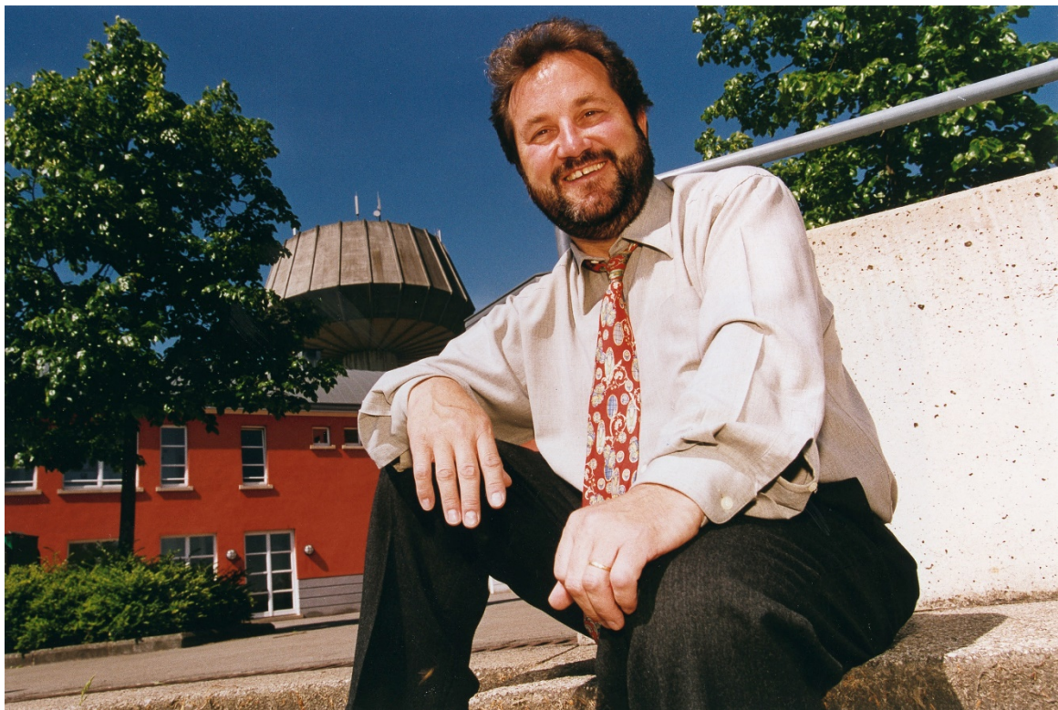
De Buergermeeschter virun „sengem“ Waassertuerm an enger Gemeng um Stand vun der Zäit.

Déi Sue ginn och net zur Fënster erausgehäit, mee kommen direkt de Leit vun der Gemeng zegutt a fléissen an hir Liewensqualitéit. Natierlech heescht et och hei, Mooss halen, awer d'Moderniséierung vun enger Infrastruktur ass net bëlleg. Dem Buergermeeschter Gibéryen seng politesch Géigner hunn him dacks virgehäit, datt seng Gemeng héich verschëllt war. Mee Fréiseng ass ënnert dem Gast systematesch moderniséiert ginn. An et ass keen Zoufall, datt vill Geld an d'technesch Infrastruktur gefloss ass. De Waassertuerm, deen ee scho vu Wäitem gesäit, wann een déi lescht Hiwwele viru Fréiseng hannert sech huet, ass dofir dat beschten Zeechen.