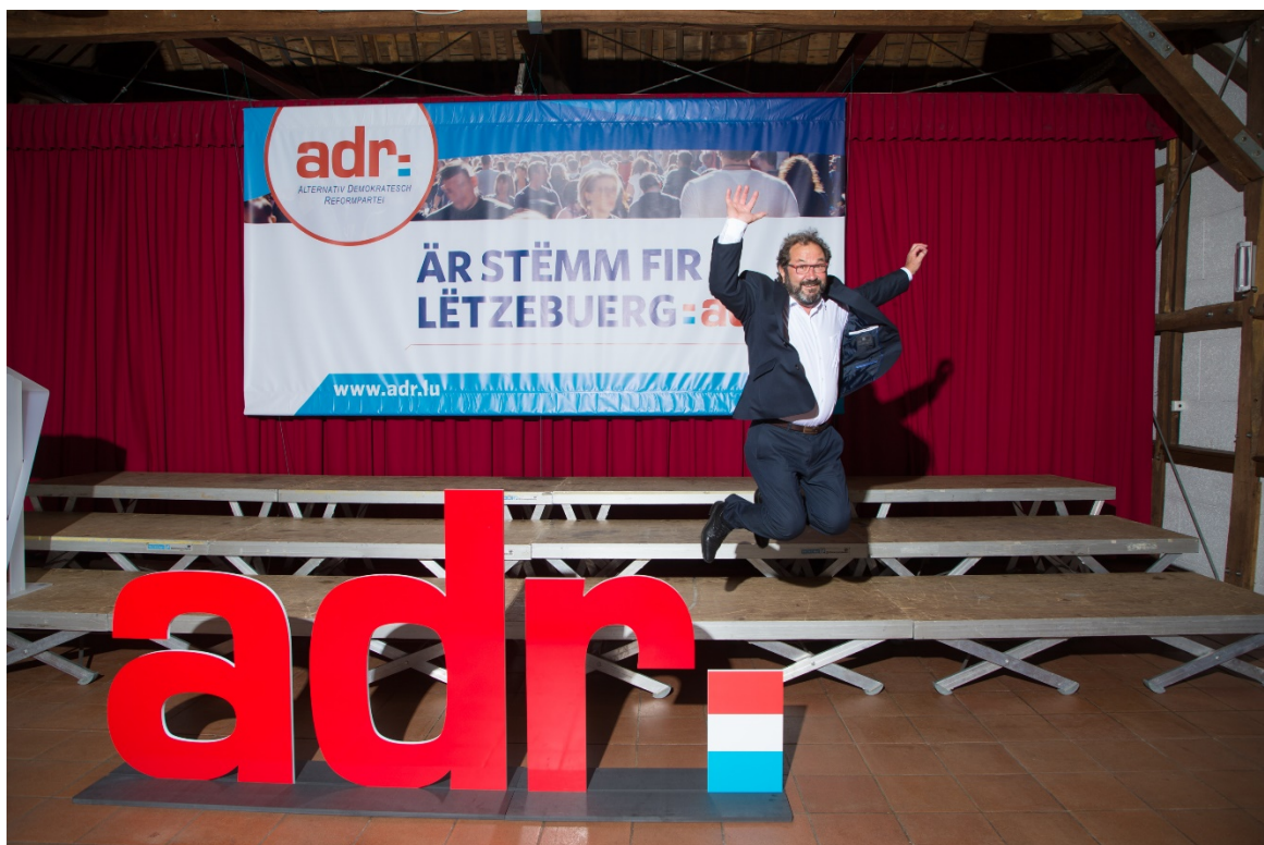
Optimismus an Dynamik 2018 - de Sprong op Fraktiounsstäerkt an der Chamber war knapps ze kuerz.

Heira fanne mer och nees de coole Gast, deen op seng Karriär zeréckkuckt. An den Hänn hält hien e besonnesch reusséiert Stéck, dat hie säi Liewe laang mat Schweess a vill Léift gefeilt huet. Et blénkt am Neon vum Atelier, alles passt, wéi et soll. Et ass gegléckt, alles dréit an näischt schleeft!