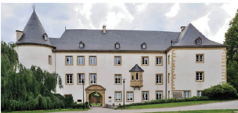
Eist Schloss ass en historeschen Schatz, deen erhale muss ginn!

D'Suessemer Schloss bitt net just e schéinen Ubléck, mat sengem schéine Park an deenen éierbaren ale Beem virdrun. Eist Schloss stellt virun allem och e Stéck vun eiser Geschicht duer an huet domat e groussen historesche Wäert.