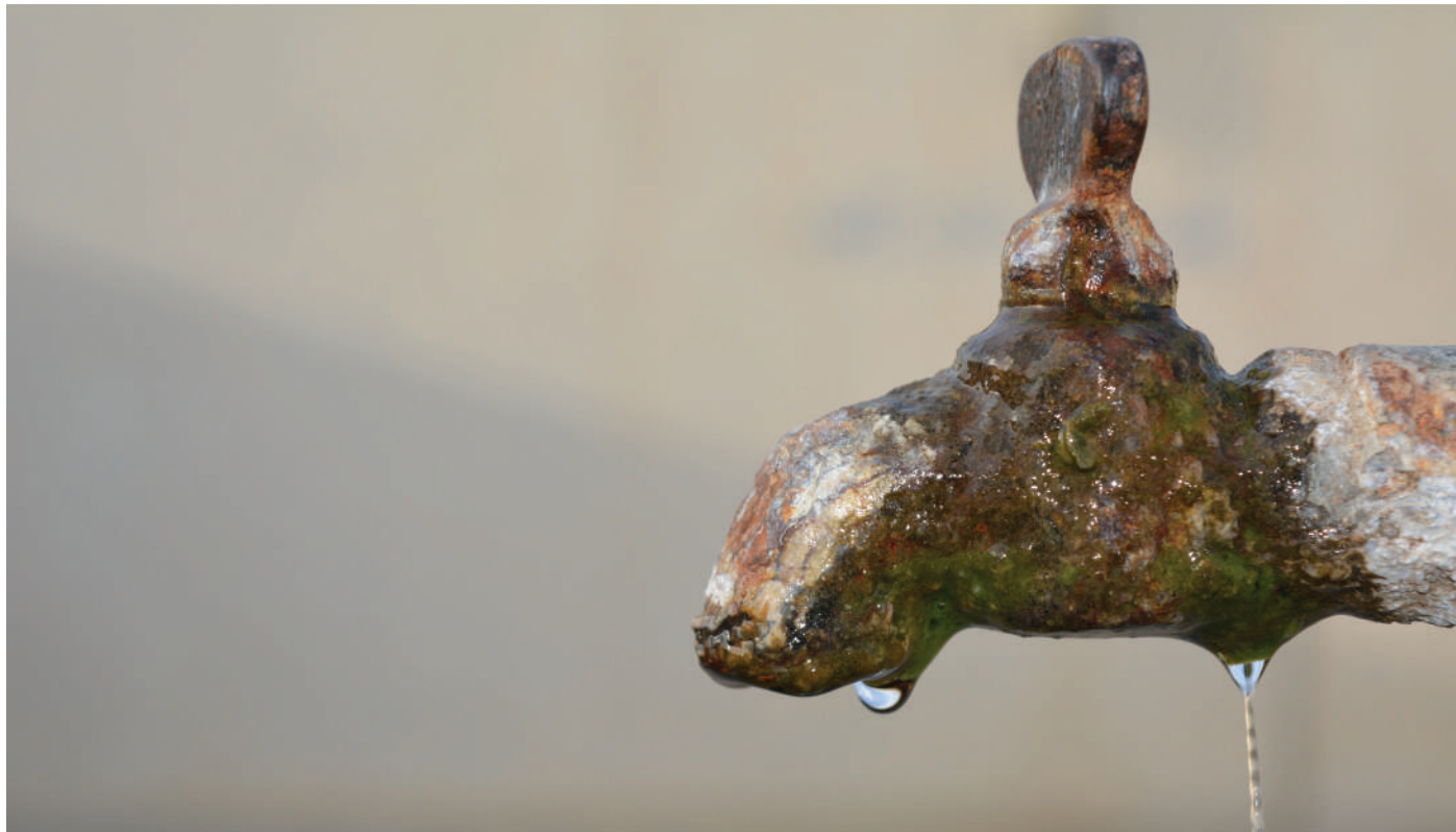
Waasser ass keen iwwerflëssege Luxus, mee e Grondbedierfnes vun all Mënsch!

Gréng wierkt ... mee just op de Portmonni!