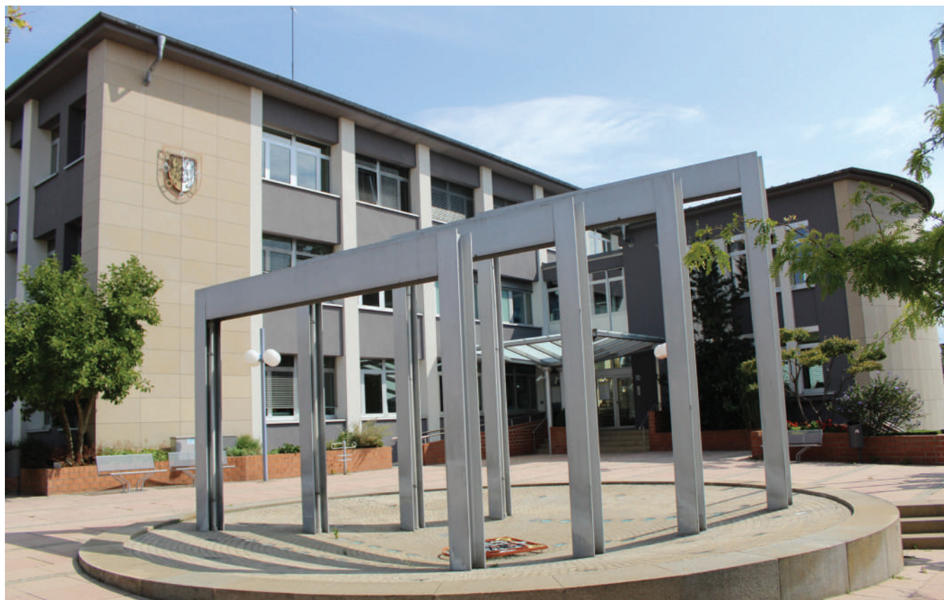
Nëmmen eng Gemeng, déi no um Bierger ass, ka fir dësen och wierklech do sinn!