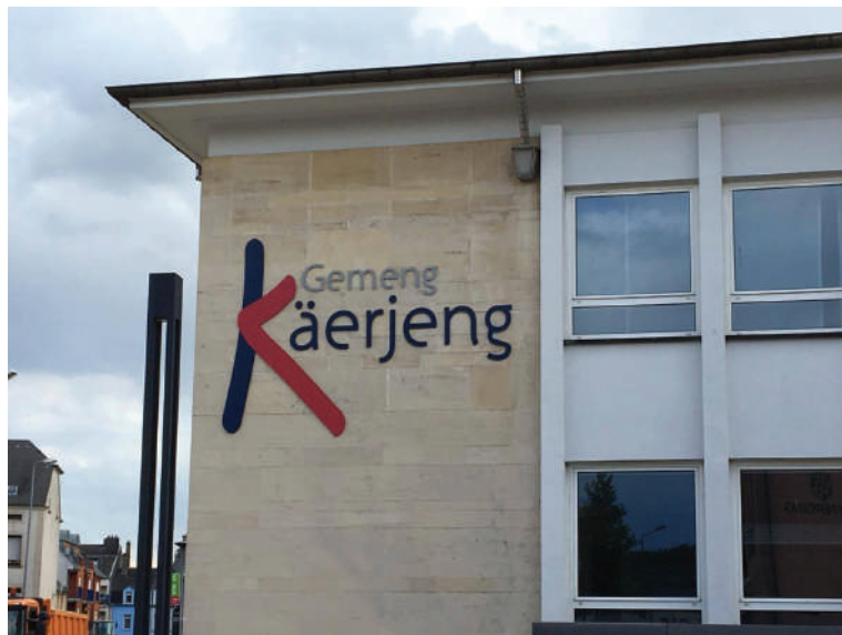
D'Politiker sinn ëmmer nëmme Mandatäre vum Vollek.

D'ADR weess, dass d'Politik net nëmme fir de Bierger muss gemaach ginn, mee, virun allem, weess si dass d'Politiker ëmmer nëmme Mandatäre vum Vollek sinn. D'Politiker stinn net iwwer dem Vollek mee si mussen sech fir d'Leit asetzen. Wann dat och fir aner Parteien vläicht „populistesch“ ass – fir eis ass et eng Verpflichtung, op déi mir houfreg sinn.