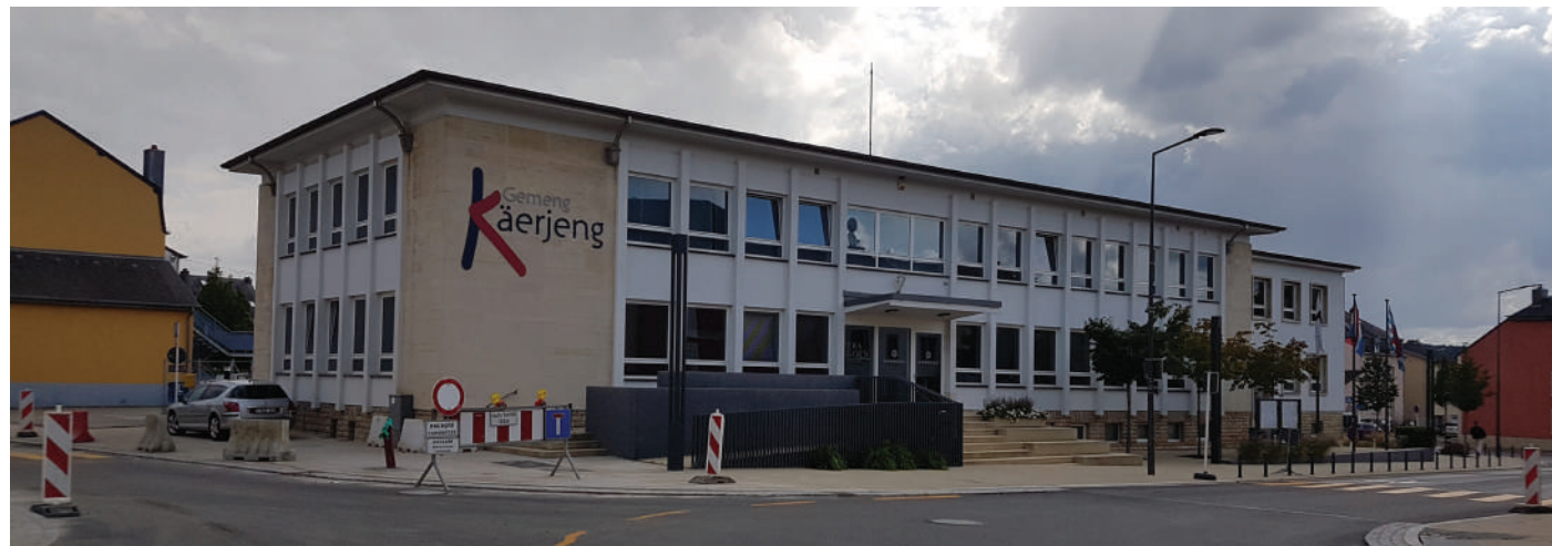
Nëmmen eng Gemeng déi no um Bierger ass, ka wierklech fir dësen do sinn!