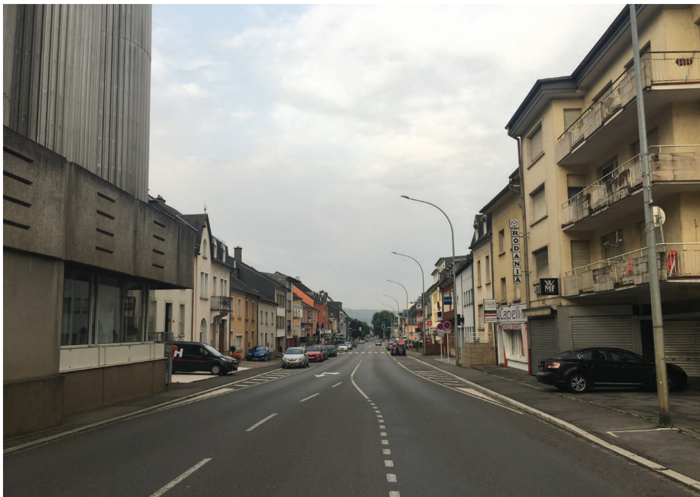
Käerjeng brauch e neien urbanistesche Konzept: manner Stroossen, méi mënschefrëndlecht Wunnen!

De Vëlo ass an deene meeschte Fäll méi e Sport- a Fräizäitgefier wéi e Fortbewegungsmëttel, fir schaffen oder akafen ze fueren. Deementspriedend sollte Vëlospisten och méi regional an touristesche sinn an ausgebaut ginn.