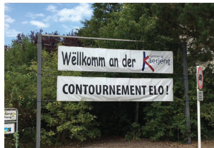
De Contournement elo ... awer mat enger intelligenter Léisung, w.e.g.!

Ausserdeem ass d'ADR Käerjeng der Meinung, datt den Impakt op Suessem muss esou kleng wéi méiglech sinn. Déi Variant vun der ADR huet d'Regierung awer bis elo leider net analyséiere gelooss – wéi si seet aus Käschtegrënn. D'ADR verlaangt awer, datt hir Propositionen seriö analyséiert gëtt! Ass et der Regierung – wuelgemierkt ënner grénger Bedeelegung! – da léiwer, d'Ëmwelt weider ze schiedegen, amplaz no verantwortungsvolle Léisungen ze sichen?