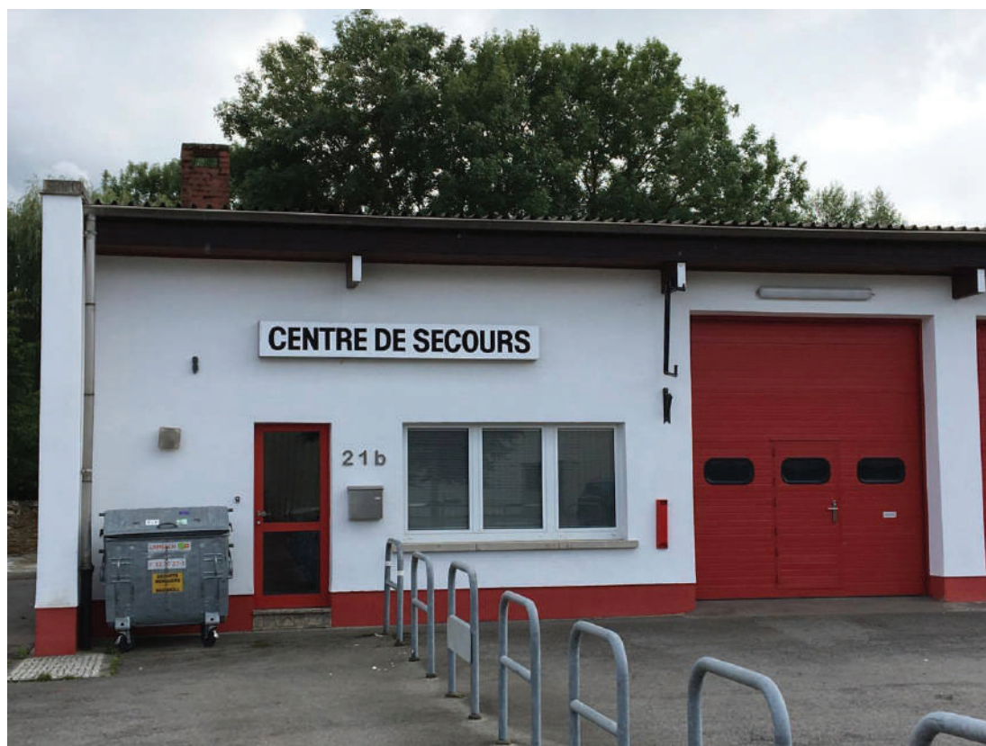
Och de lokale Rettungsdéngscht spillt eng wichteg Roll bei der Sécherheet.

D'Pompjées- an d'Rettungswiese sollen an eisen Aen déi néideg Ënnerstëtzung kréien, fir sech beschtméiglechst op lokalem Terrain organiséieren ze kënnen. Datt si dobäi da mat nationalen, professionellen Unitéite kënnen a sollen intensiv zesummeschaffen ass eng Selbstverständlechkeet.