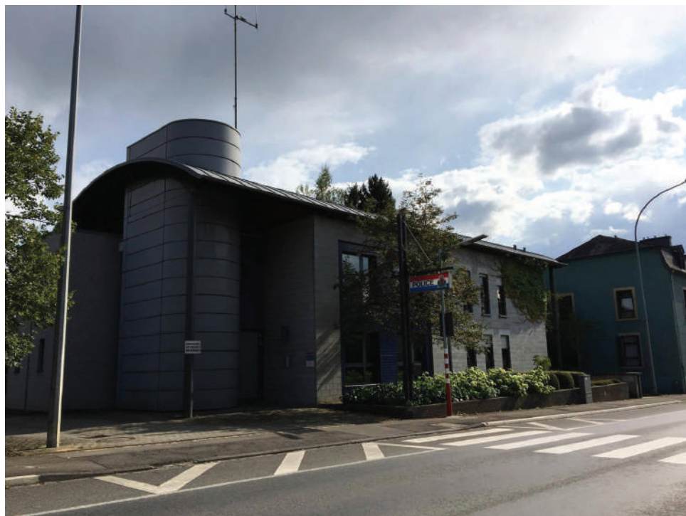
D'ADR wëllt, datt Käerjeng en eegene Polizei-Kommissariat behält.

D'ADR hält och drop, datt d'Vitesslimiten an de Wunnquartieren agehale ginn. Déi Stroosse si keng Schnellstroosse oder Schläichweeër fir presséiert Pendler. Hei geet et schliisslech ëm d'Sécherheet vun eise Kanner!