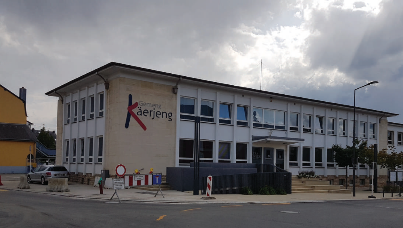
Souwuel bei den Infrastrukture wéi och bei der Entwécklung vun der Zuel vun hire Mataarbechter muss eis Gemeng Fouss bei Mol behalen.

Dir wëllt der ADR bei dëse Gemengewalen esou gutt wéi méiglech hëllefen? Eise Walsystem erlaabt lech dat op zwou Manéieren: Am einfachsten a séchersten ass et, wann Dir de Krees iwwert der ADR-Lëscht schwaarz maacht. Esou stellt Dir net nëmme sécher, datt keng Stëmm fir d’ADR verluer geet, mee dir ënnerstëtzt domat och all ADR-Kandidat gläicher Moossen. Wann Dir awer ee vun eise Kandidate besser kennt oder ganz besonnesch gutt fannt an dësen dofir gär extra ënnerstëtze wëllt, da kënn Dir Ärem Wonschkandidat och zwou Stëmmen ginn. Duerno fänkt dann allerdéngs d’Zielen un: An deene Këschtercher hannert de Kandidatennimm kënn Dir insgesamt 15 Kräizer verdeelen, dann hutt Dir Äre Stëmmmaximum erreecht, an dësen däerf net iwwerschrott ginn. De Krees iwwert der ADR-Lëscht däerft Dir dann awer NET méi markéieren.