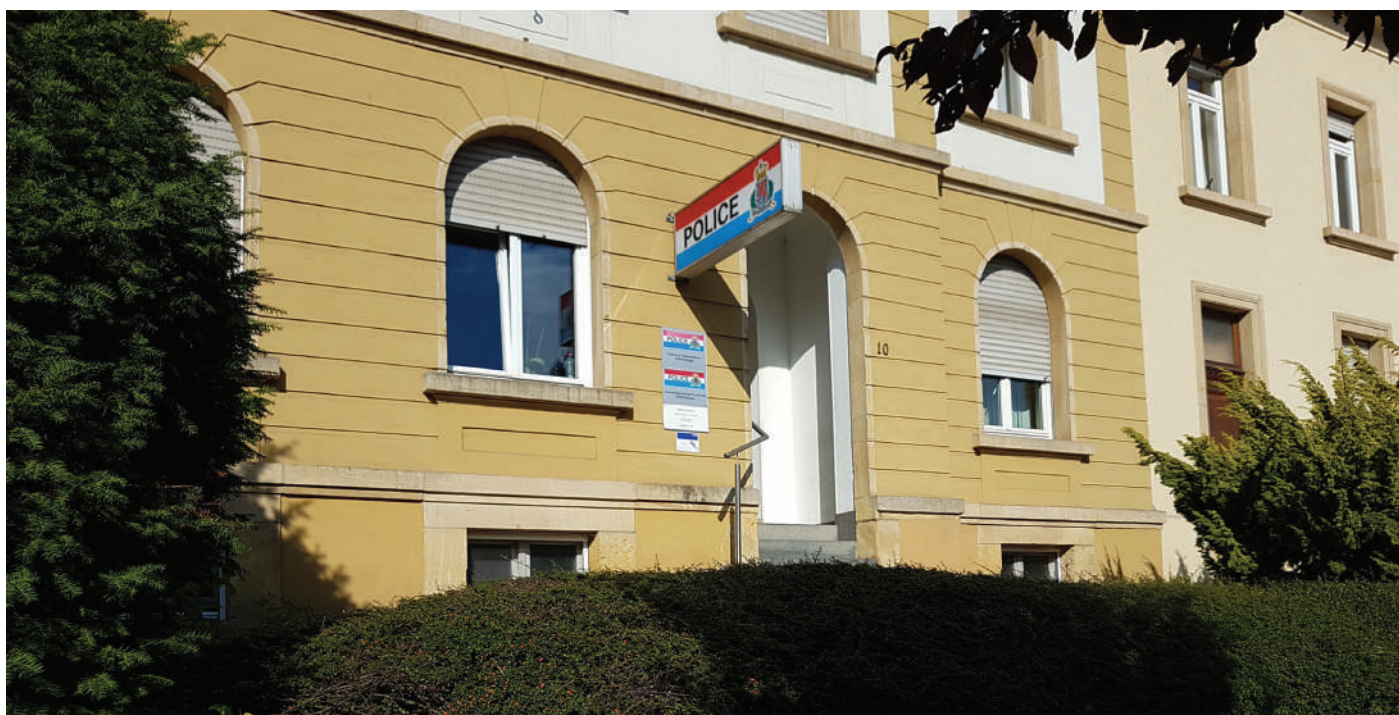
Wat notzen déi bescht Reglementer, wann net genuch Police d'Sécherheet garantéiert?

D'ADR verdeedegt de Choix vum Bierger a säi Recht, säi Liewen an eventuell säi Betrib no beschemt Ermoossen ze féieren.