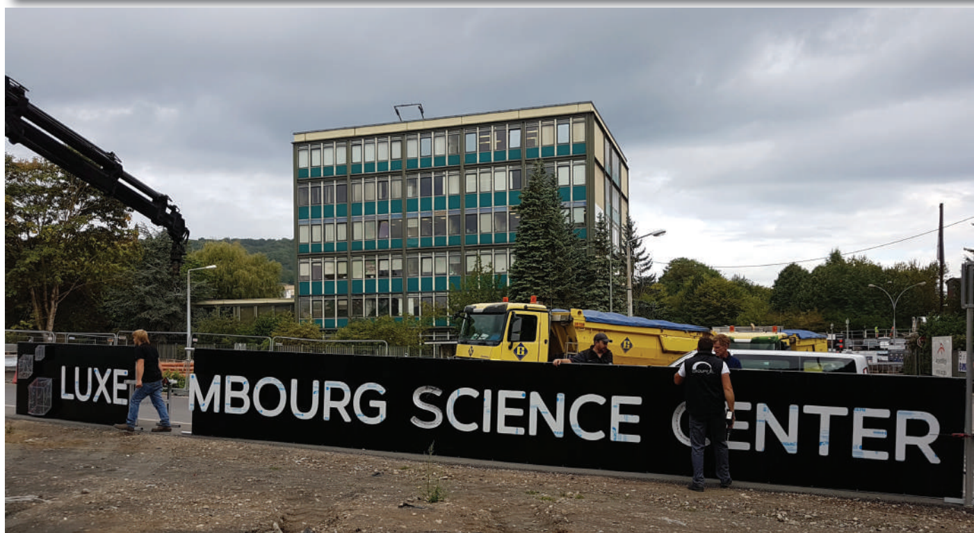
Déifferdeng wíisst a wíisst a gëtt zesummegeäckelt ...