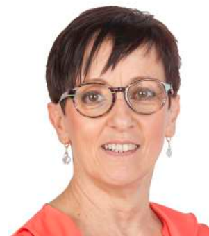
Gasbarrini Olympia 59 Joer, Fousbann Geschäftsfra