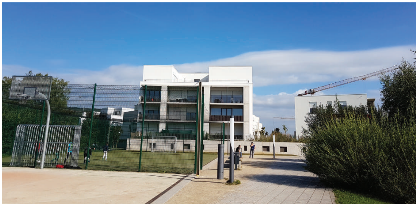
Bezuelbaren a liewenswäerte Wunnraum ass beim aktuelle Wuesstem déi Erausforderung ...

Dat traditionellt Lëtzebuerger Bild vum eegenen Eefamilljenhaus ass fir vill Leit net méi ze bezuelen. Dat wäert de Charakter vun eisen Uertschaften änneren. D'Gemeng muss awer oppassen, datt hire Charakter net vëlleg entstallt gëtt. Si muss kucken fir ënnert dem Bevëlkerungsdrock natierlech ze wuessen a weider Liewensqualitéit ze bidden. Si däerf net zur Schlofgemeng oder zur Wunnsiddlung ouni Séil ginn.