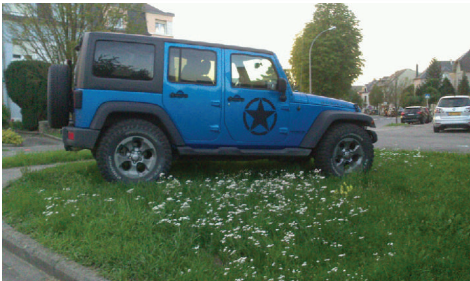
Parkproblem a Parkmoral zu Beetebuerg: D'ADR wëll seriö Kontrollen.

De Verkéier zu Lëtzebuerg gëtt ëmmer méi schlémm. D'Gemeng muss e sécher a gläichberechtigt Matenee vun alle Leit am Verkéier garantéieren.