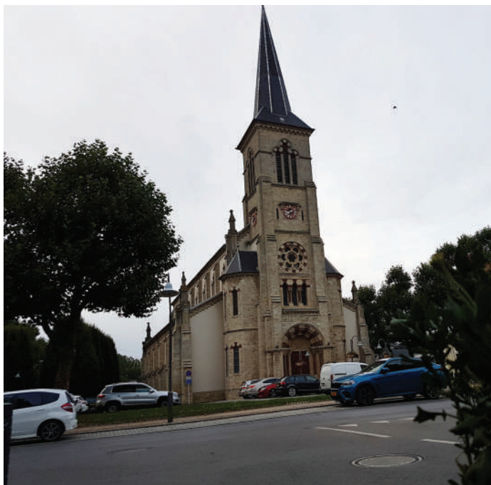
Weider eng Gemengenaufgab: Erhalt a respektvollen Ëmgang mat kierchlecher Bausubstanz