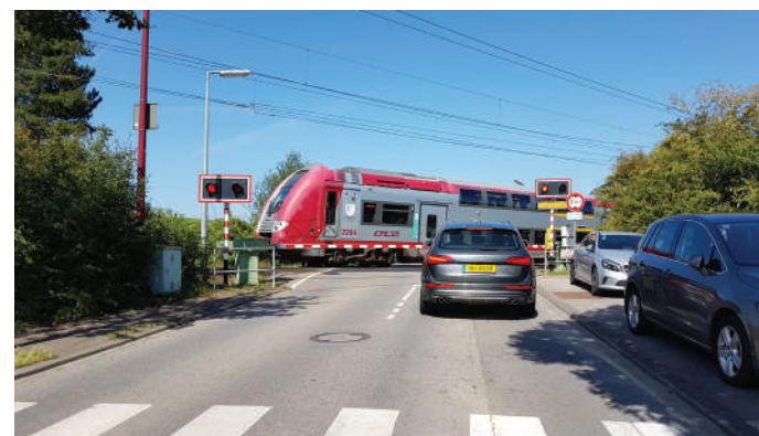
Fir wéini eng Léisung fir d'Näerzenger Barriären?

Vëlosservicer, wéi si a verschiddenen Uertschaften bestinn, géinge vun eis op hiren Notzen an hir Käschte gepréift ginn. Och de Sécherheetsrisiko duerch ongeübte Vëlofuerer, de récksiichtslosen Asaz a Foussgängerzonen, d'Benotze vum Vëlo als Spillsaach an de Vandalismus, deem dës Gefierer ausgesat sinn, sollen ënnersicht ginn.