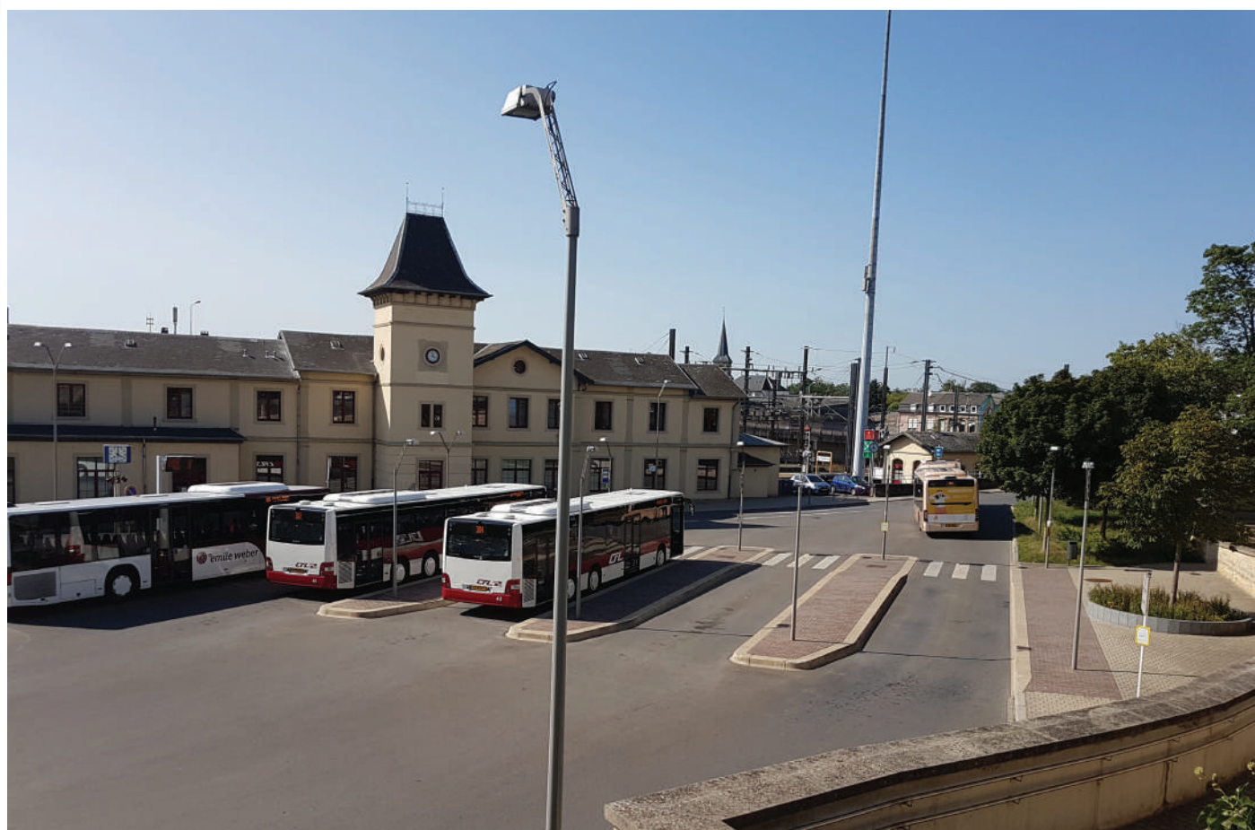
Ronderëm d'Gare vu Beetebuerg mat hirem grouse Parking an hiren Ënnerféierungen ass vill ze soen, wat d'Sécherheet vu Foussgänger (besonnesch am Däischteren) ugeet.

Pompjees- a Rettungswiese si fir d'ADR e wichtege Bestanddeel vun der lokaler Sécherheet. Dofir sollen dës Kräfte déi néideg Ënnerstützung kréien, fir sech beschtméiglechst organiséieren ze kënnen.