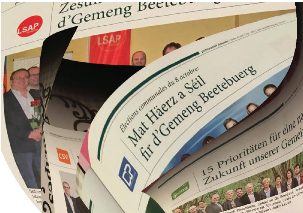
Véier Parteie seene sech beim Buet an déi aner kënnen kucken, wou si bleiwen.

Komesch demokratesch Iddien huet de schwaarz-blo-gréng Schäfferot hei zu Beetebuerg, an och déi rout Opposition mësch mat. Hat net de schwaarze Buergermeeschter a senger Parteifunktioun scho verlaude gelooss, datt hie keng Regierungskoalitioun mat der ADR géng wëllen ... iwwer e Joer virun de Chamberswalen, bei deene kee weess, ob d'CSV iwwerhaupt an d'Regierung kënn? Wuel fir seng gréng Kumpanen an der Gemeng ze schounen?