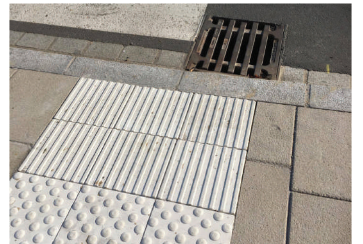
Bravo Gemeng Beetebuerg fir des Fal an der Collart-Strooss.

D'Beetebuerger Gemeng huet och esou Markéierungen maache gelooss. Wann des allerdéngs schnouerriicht op eng Zëtär hiféieren, wou ee ka falen (oder mat sengem Bengel hänke bleiwen), ass dat keng Hëllef mee eng Fal, wéi an der Collart-Strooss.