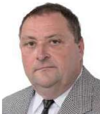
Pleger Claude Aasselburren Aarbichter