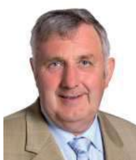
Engelen Jeff Tratten Gemengerot