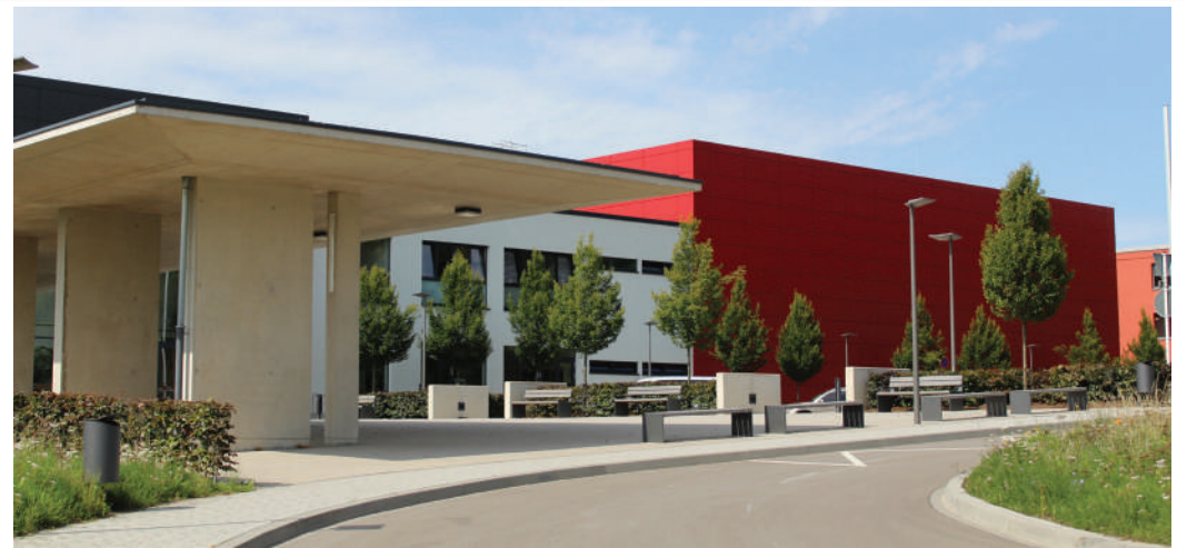
Den Zougang zur Kultur mécht de Mënsch zougänglech fir d'Gesellschaft.