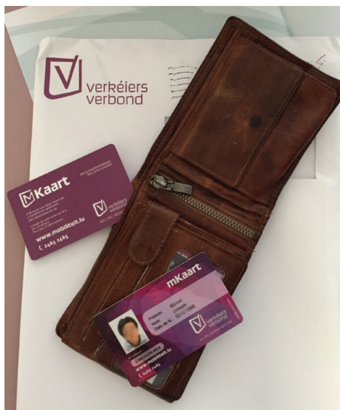
E Joresabonnement däerf kee Privileg sinn.

Fir déi betraffe Leit ass e Joresabonnement vu 440 Euro – dat an enger Kéier bezuelt gi muss – eng deier Investitioun. Dofir wäert all Gemeng, wou d'ADR en Entscheidungsrecht huet, dat Abonnement finanzéieren hëllefen, z.B. iwwer eng Avance, déi am Laf vum Joer kamoud op de Mount kann zrëckbezuelt ginn. Esou musse sie déi beträchtlech Zomm net ënnerhalb engem Mount abéissen a si spueren 160 Euro d'Joer géigeniwwer dem Abonnement op de Mount.