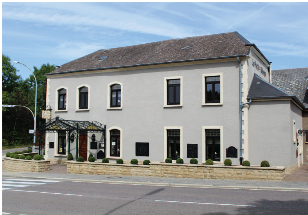
De lokale Charme vun der Gemeng soll och fir Touristen attraktiv bleiwen.