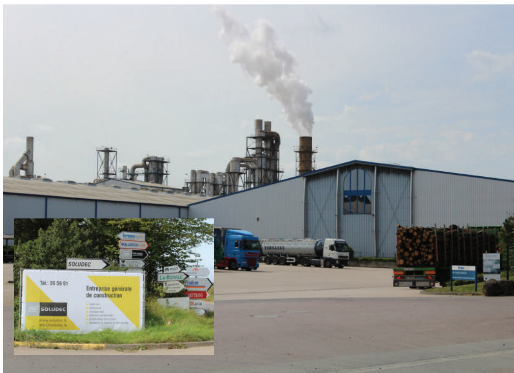
D'Ëmweltbelaaschtung duerch d'Industriezon muss am A behale ginn!

Der ADR läit d'Ëmwelt um Häerz. Mee d'Problemer mat deem onerhéierte Wuesstem, dee Lëtzebuerg iwwer d'Joerzénge kennt, verlaangen no Léisungen.