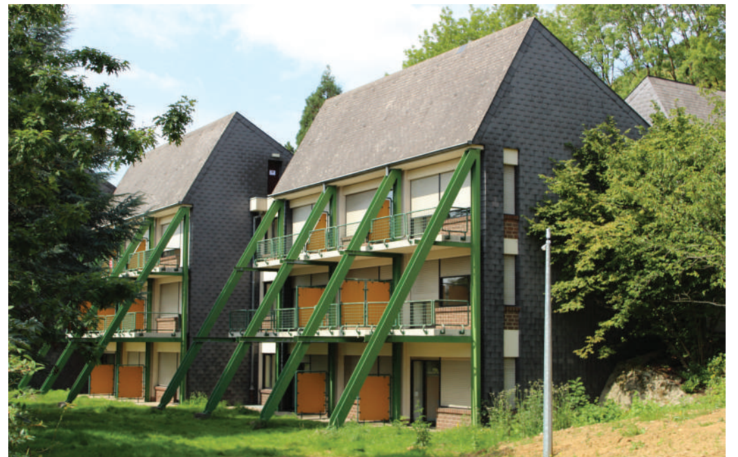
Ob Flüchtlingen an d'Gemeng kommen, däerf de Staat net eleng decidéieren!

Grondschoul opgeholl ginn, ënnert der strikter Bedéngung, datt de Schoulministère zousätzlech Ressourcen (besonnesch Personal a Material) dofir bereet stellt.