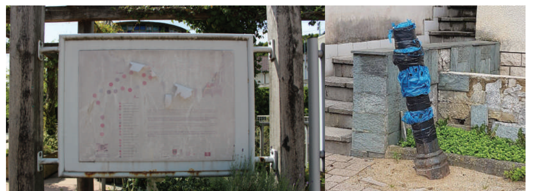
Eng gutt geréiert Gemeng hält hir öffentlech Infrastruktur an der Rei a fléckt oder erneiert déi Saachen, déi futti sinn ënnerhalb kierzter Zäit.