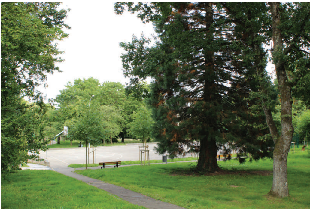
De breede Publikum an all Altersklass soll kënnen sportlech aktiv sinn.