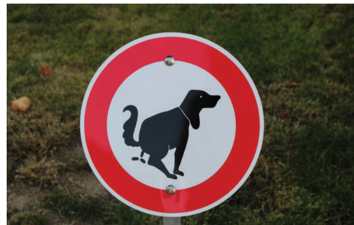
D'Gemeng mat ëffentlechen Toilettë propper halen.

an all Uertschaft vun dëser Gemeng mat nach wéinstens enger zousätzlecher ëffentlecher Toilette versueren.