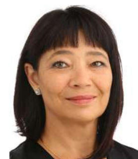
Soultanova Goulнора Märel