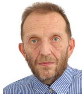
Wickeler Mill Bouneweg