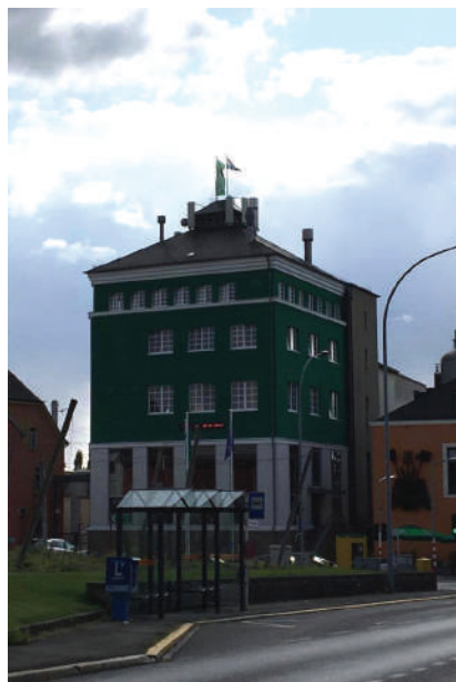
D'Brauerei Bofferding ass net just fir d'Touristen eng Attraktioun, déi e Besuch wäert ass!

Eis Gemeng huet nach vill ze dacks de Charakter vun engem Stroossenduerf. D'ADR wëllt d'Uertschaften an eiser Gemeng méi attraktiv maachen. Dëst fir eis eegen Awunner, an awer och als Deel vun engem regionalen, touristesche Konzept.