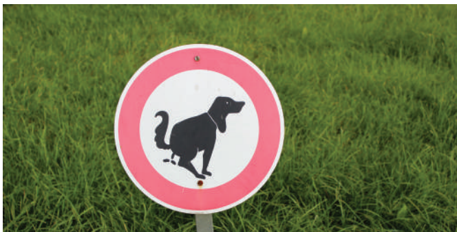
D’Gemeng mat Hëllef vun Hygiënestuten an Hondstoilettë propper halen.

Wann en Hond stierft an e gëtt duerch en neien ersat, dann ass d’ADR der Meenung, datt fir dat Joer nëmmen eemol soll d’Hondstax musse bezuelt ginn. An deem Fall, wär also fir deenn neien Hond am éischte Joer keng Tax fälleg.