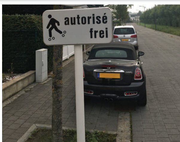
D'Trëttoire sinn net fir d'Autoen do! Och net bei der Käerjenger Gare!

D'ADR denkt do anescht! Si ass fir den Auto a wëllt fir genuch Parkplaz suergen. Si ass och fir de generaliséierte Parking résidentiel an de Wunnzonen.