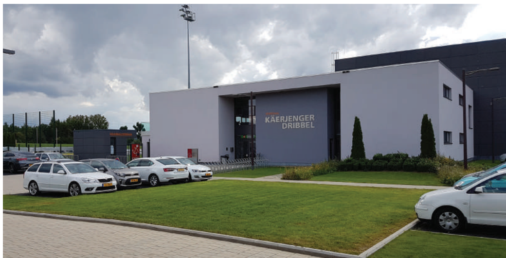
De breede Publikum an all Altersklass soll kënnen sportlech aktiv sinn.

D'ADR wëllt dofir suergen, datt déi lokal Veräiner all déi Mëttelen hunn, déi si fir hiren Asaz brauchen. Mee och déi normal Fräizäitaktivitéite baussent de Clibb - eleng, mat Frënn oder an der Famill - sollen ënnerstëtzt ginn. Spill- an Hobbyplazen fir Grouss a Kleng soll et och an de Parken an an der Natur ginn. Dës och mol iwwerdeckt, well souguer zu Käerjeng soll et heiandsdo reenen. Fir d'ADR ass et eng Herausforderung, fir Käerjeng an deem Sënn méi attraktiv ze maachen.