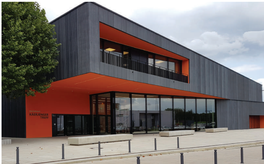
Den Zougang zur Kultur mécht de Mënsch zougänglech fir d'Gesellschaft.

Fir eis ass et wichteg och dem Buch an dem Liesen eng Plaz an eisem Kulturliewen ze erhalen. Eng gutt, ëffentlech Bibliothék a Bicherstief sinn dofir ëmmer en Thema fir eis.