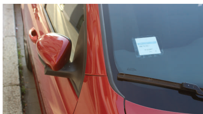
Et ass der Gemeng hir Aufgab, hiren Awunner eng Léisung fir de Parkplazproblem ze bidden!

Op der Käerjenger Gare mussen mat engem vernünftege Bau-Konzept méi P&R-Plazen geschaf ginn.