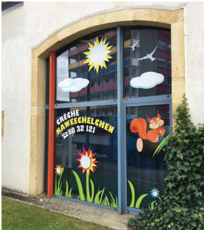
D’Eltere müssen hir Kanner a gudden Henn wëssen, ouni Suergen ëm Qualitéit, Fërderung an Entfalung.