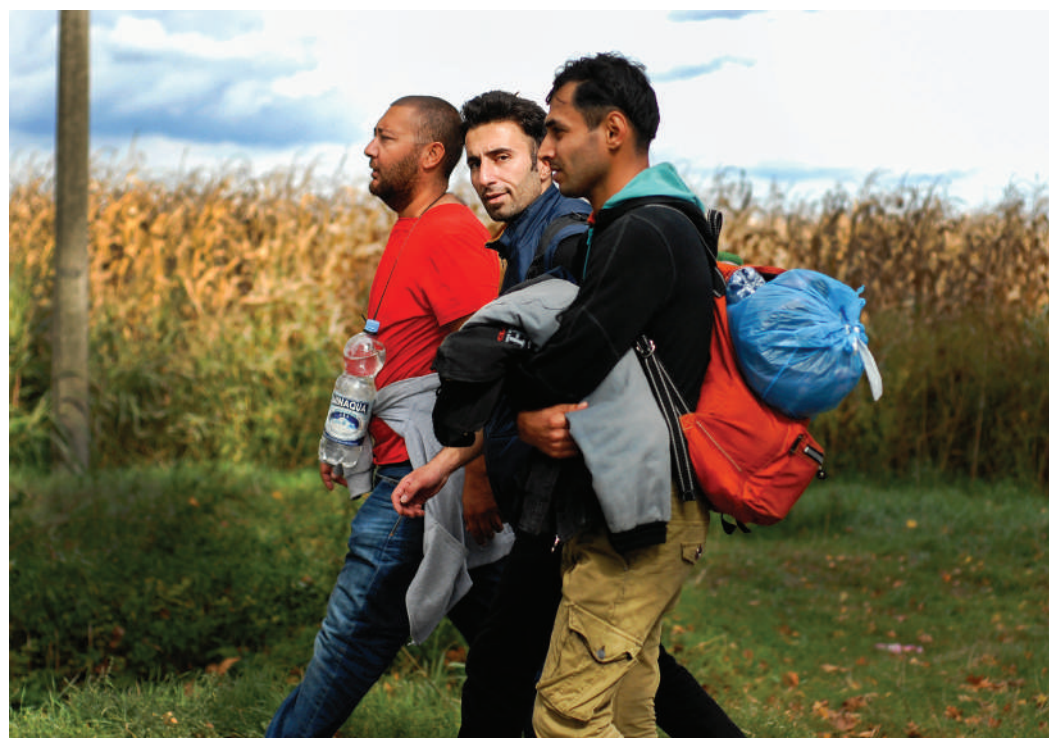
Ob Flüchtlingen an d'Gemeng kommen, däerf de Staat net eleng decidéieren!

Speziell an der Wunnengsfro verlaangt d'ADR, datt déi sougenannte Containerdierfer den Accord vun der Gemeng mussen hunn, an datt de Staat net just iwwer d'Prozedur vum POS (plan d'occupation des sols) däerf verfueren. Fir d'ADR däerf et dobäi och net zu "Ghettoen" kommen an et musse kloer, gerecht an transparent Prozeduren ginn, déi d'nämmlecht sinn, fir ALL Leit, déi eng (Sozial-)Wunneng brauchen a sichen. Et däerf keng Privilegierung oder Diskriminierung vun deem Engen oder Anere ginn.