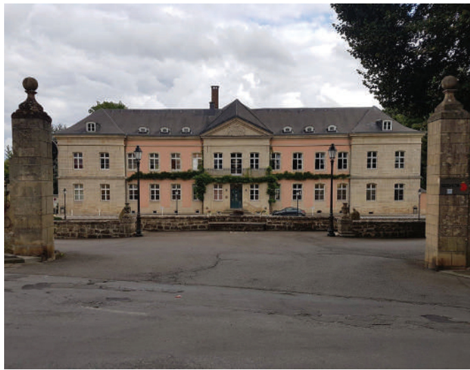
D'Kanner sinn eis Zukunft, mee déi eeler Leit an déi mat Krankheet oder Behënnerung zielen och!

Et kann ee vill fir déi Leit maachen, déi op Ennerstëtzung ugewise sinn, wann een u si denkt a sech fir si engagéiere wëllt, esou wéi d'ADR dat mécht!