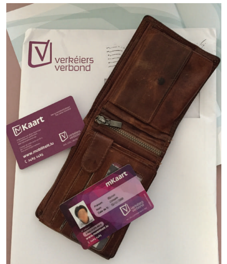
E Joresabonnement fir den ëffentlechen Transport däerf kee Privileg sinn.

Fir déi betraffe Leit ass e Joresabonnement vu 440 Euro – dat an enger Kéier bezuelt gi muss – eng deier Investitioun. Dofir wäert all Gemeng, wou d'ADR en Entscheedungsrecht huet, dat Abonnement finanzéieren hëllef, z.B. iwwer eng Avance, déi am Laf vum Joer kamoud op de Mount kann zrëckbezuelt ginn. Esou musse sie déi beträchtlech Zomm net ënnerhalb engem Mount abëssen a si spueren 160 Euro d'Joer géigeniwwer dem Abonnement op de Mount.