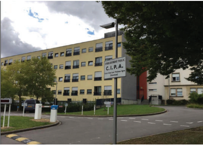
Altersheem zu Nidderkuer a Fleegeheem zu Déifferdeng: Wou bleiwen esou Infrasstrukture bei eis?

D'Gemeng ass och do, fir den eelere Matbierger, deene gesondheetlech ageschränkten an deene mat Behënnerung d'Liewen esou einfach a liewenswäert wéi méiglech ze maachen. Beispillsweis muss si dozou bäidroen, datt déi Leit net aus dem gesellschaftlechen, kulturellen oder sportleche Liewen ausgeschloss ginn. Dofir kënnen ënnert anerem och intergenerationell Projekte ganz sënnvoll sinn.