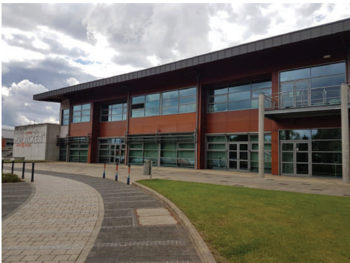
D’Gemeng muss den Dialog tëscht den Elteren an de Betreuungsstrukturen aktiv fërderen.

D’Kanner sinn d’Zukunft vun eiser Gesellschaft. Eng optimal Betreung an Erzéiung, déi och den neie Liewensgewunnechte gerecht gëtt, hu fir d’ADR absolut Prioritéit. D’ADR wëllt den Elteren e wierklechen, materiell realistesche Choix ginn, fir hir Kanner selwer ze erzéien oder qualitativ héichwäerteg Strukturen ze gebrauchen.