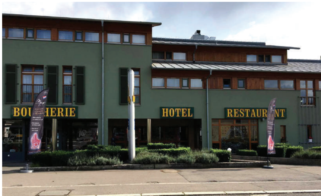
De lokale Charme vun der Gemeng soll och op d'Touristen attraktiv wierken. Mir müssen erreechen, datt si hiren Openthalt net just op d'Duerchfahrt oder en lesse beschränken, an op d'mannst eng Nuecht an engem vun eise lokalen Hotellen verbréngen.

Fir d'ADR ass den Engagement an der Gemeng eng Verpflichtung fir d'Liewensqualitéit vun de Leit ze verbesseren. An dozou gehéieren och Kamouditéiten, ewéi de Bäcker, d'Epicerie an de Café am Duerf. Dofir wëlle mir eis dorëm këmmen, datt esou Geschäfte och nees kënnen an déi méi kleng Dierfer vun der Gemeng kommen.