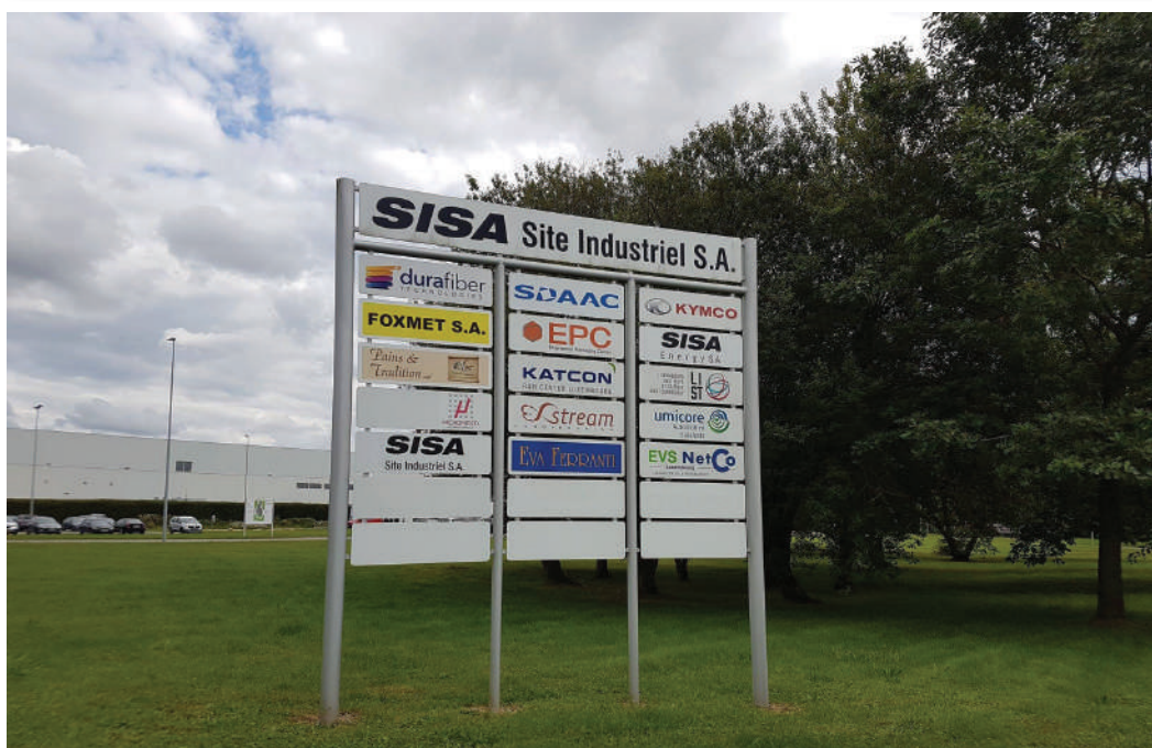
D'Ëmweltbelaaschtung duerch d'Industriezon muss am A behale ginn!

D'Ëmweltproblemer mat deem onerhéierte Wuesstem, dee Lëtzebuerg elo schonn iwwer Joerzéngte kennt, verlaangen no Léisungen.