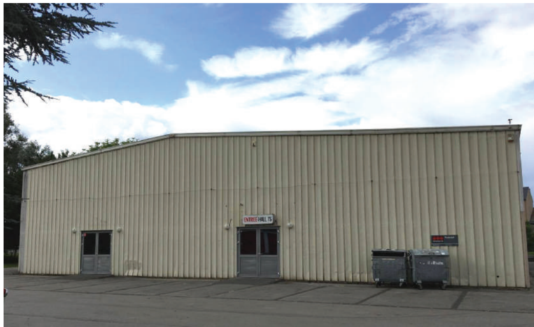
Eng Gemeng këmmert sech ëm hir Gebaier a léisst hir landbekannte Manifestatiounshal (Hal 75) net einfach verkommen.

D'ADR steet fir eng staark Gemengenautonomie. All Themen, déi op kommunalem Niveau kënne behandelt ginn, sollen och an der Verantwortung vun der Gemeng bleiwen. Mir setzen eis fir eng selwerbestëmmt an egeverantwortlech Gemeng an.