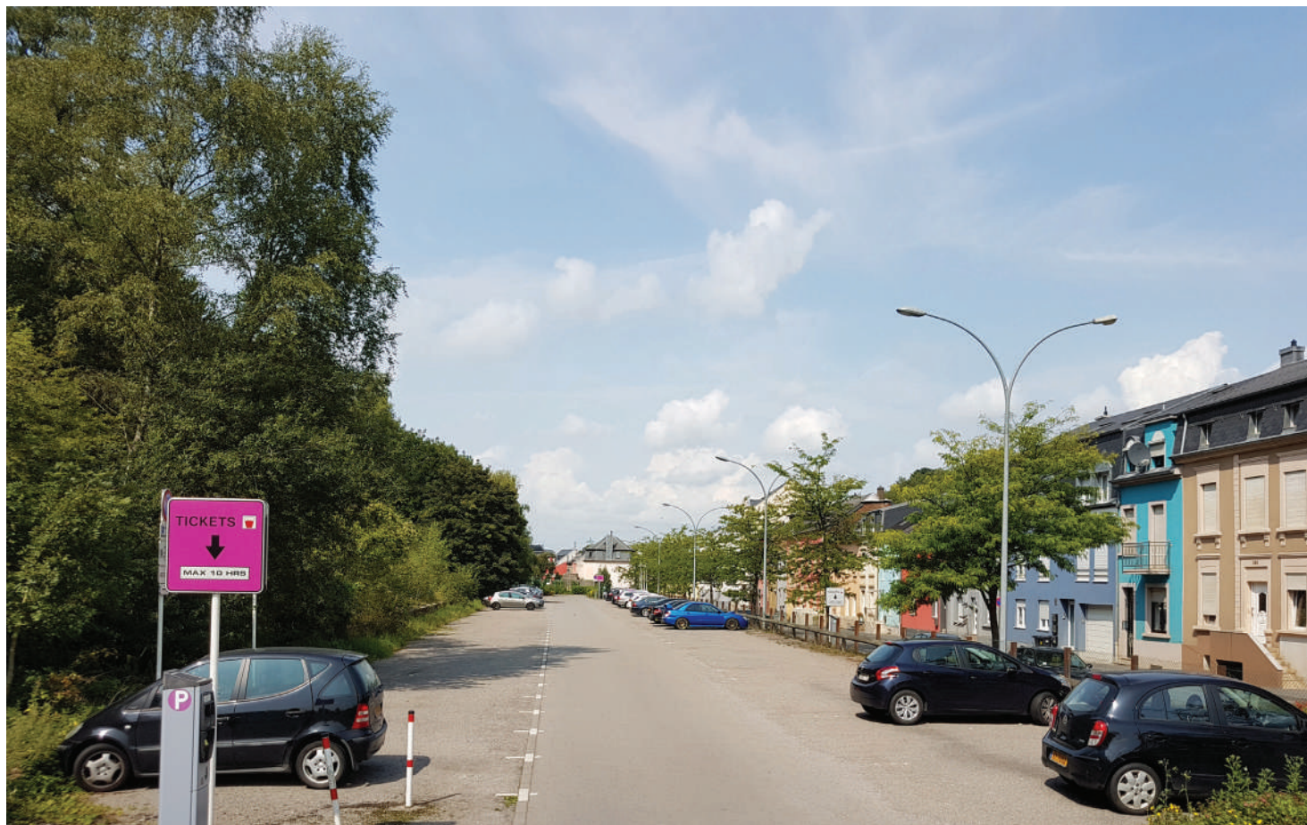
Quai Neiduerf, wou e weidert Flüchtlingsheem geplangt ass.