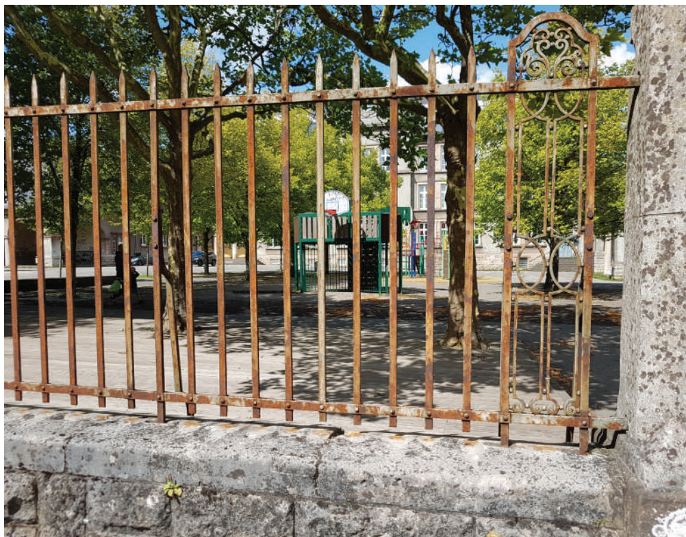
Ass dat e Schoulglänner, wat Loscht mécht op Léieren oder spillen?