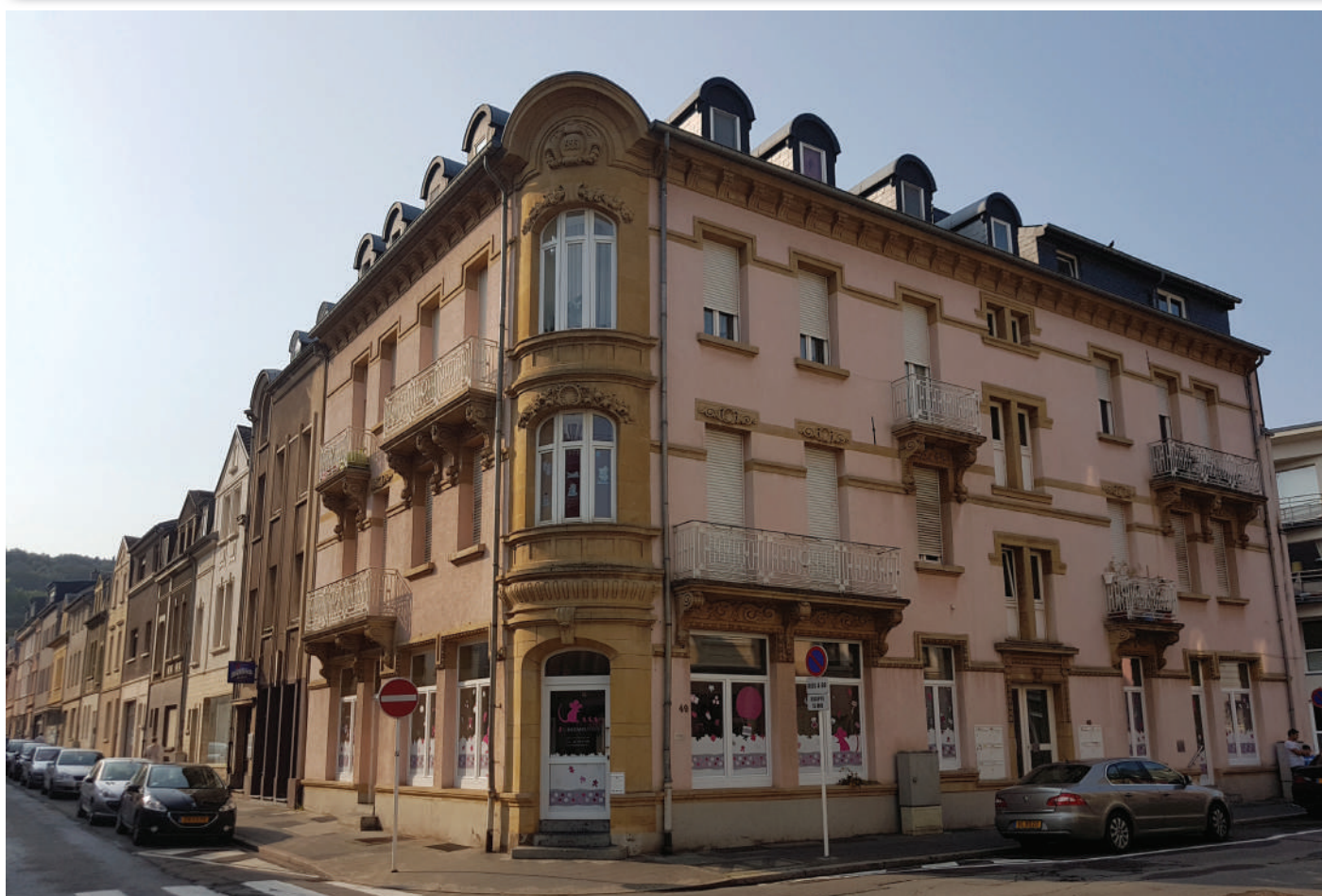
Genuch Crèchen, ob privat oder vun der Gemeng, si gefrot

D'Kanner sinn d'Zukunft vun eiser Gesellschaft. Eng optimal Betreierung an Erzéiung, déi och de neie Liewensgewunnechte gerecht gëtt, huet fir d'ADR absolut Prioritéit. D'ADR wëllt den Elteren de Choix loossen, hir Kanner selwer ze erzéien oder qualitativ héichwäerteg Strukturen ze gebrauchen. Wichteg sinn eis dobäi besonnesch och d'Problemer vun elengerzéienden Elteren. An deem Kontext stellen sech och op kommunalem Niveau eng ganz Rei wichteg Erausforderungen, déi d'ADR bereet ass, zu Esch unzepaken, andeems mär: