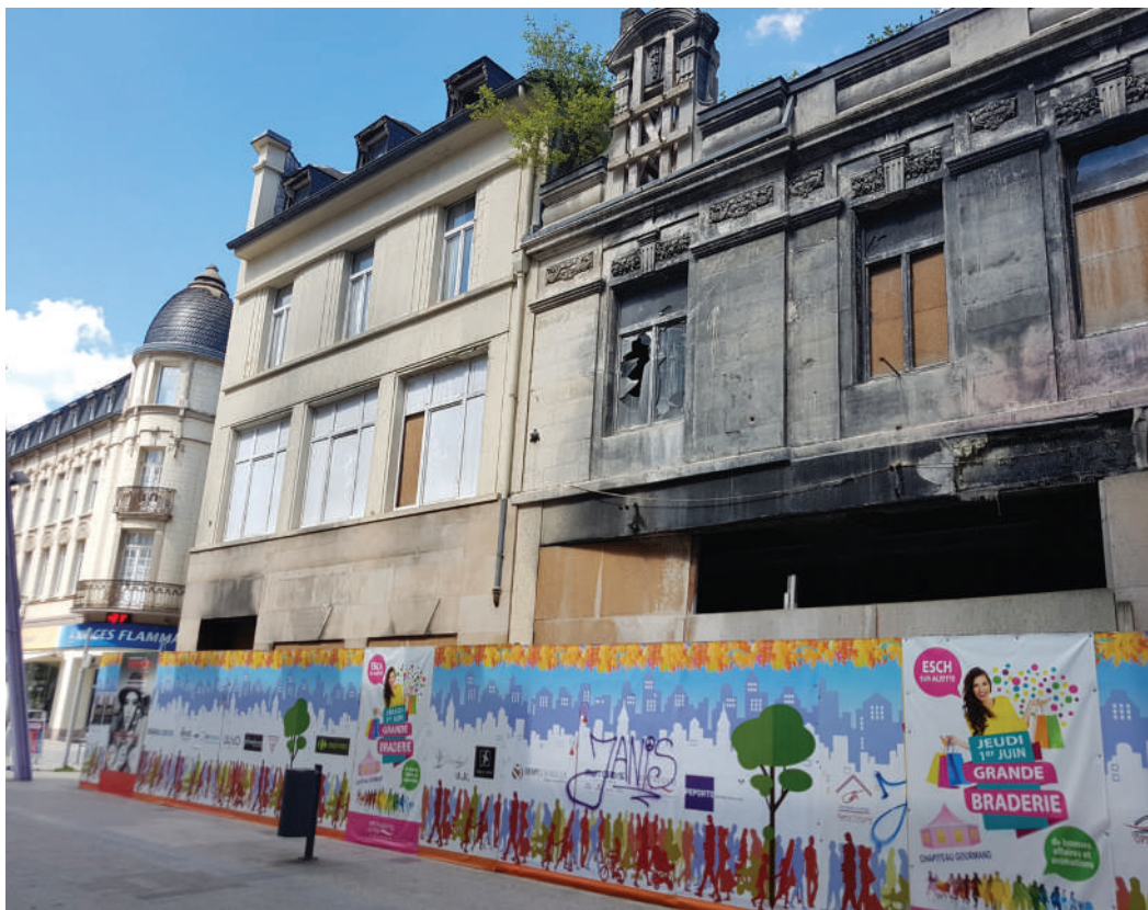
Schlecht Gouvernance: Joerelaang Ruinen an der Uelzechtstrooss ...

D'ADR steet fir eng staark Gemengenautonomie: All Themen, déi op kommunalem Niveau behandelt kënnen ginn, sollen och an der Verantwortung vun der Gemeng bleiwen. Mir setzen eis a fir eng selbstbestëmmt an eegenverantwortlech Gemeng. Fir datt d'Gemengepolitiker an deem Sënn hirer wichteger Aufgab voll a ganz gerecht kënnen ginn, well d'ADR an ärer Gemeng ëmsetzen: