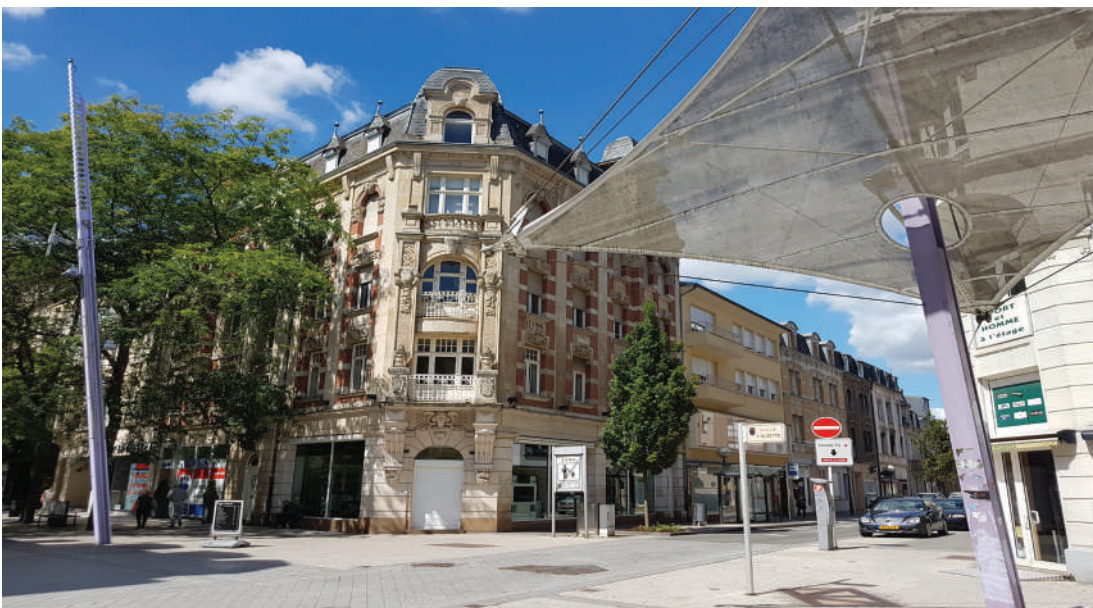
Goudronflecken an der Strooss, Knascht op de Baatschen: dat ass Esch haut!

Esch muss nees attraktiv fir all Mënsch ginn.