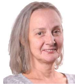
Konsbrück Malou 52 Joer Pensionéiert