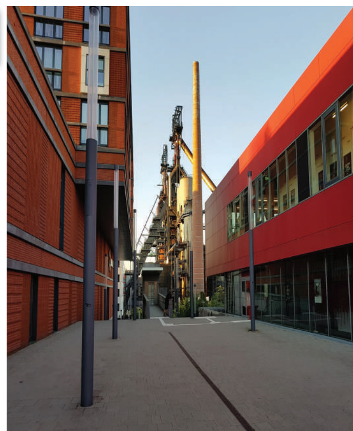
Tourismus och zu Esch eng Alternativ ...