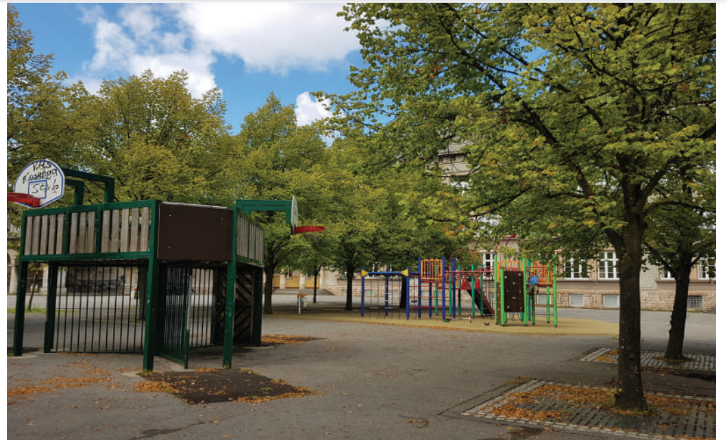
Sport fänkt scho bei deene klengen un ...