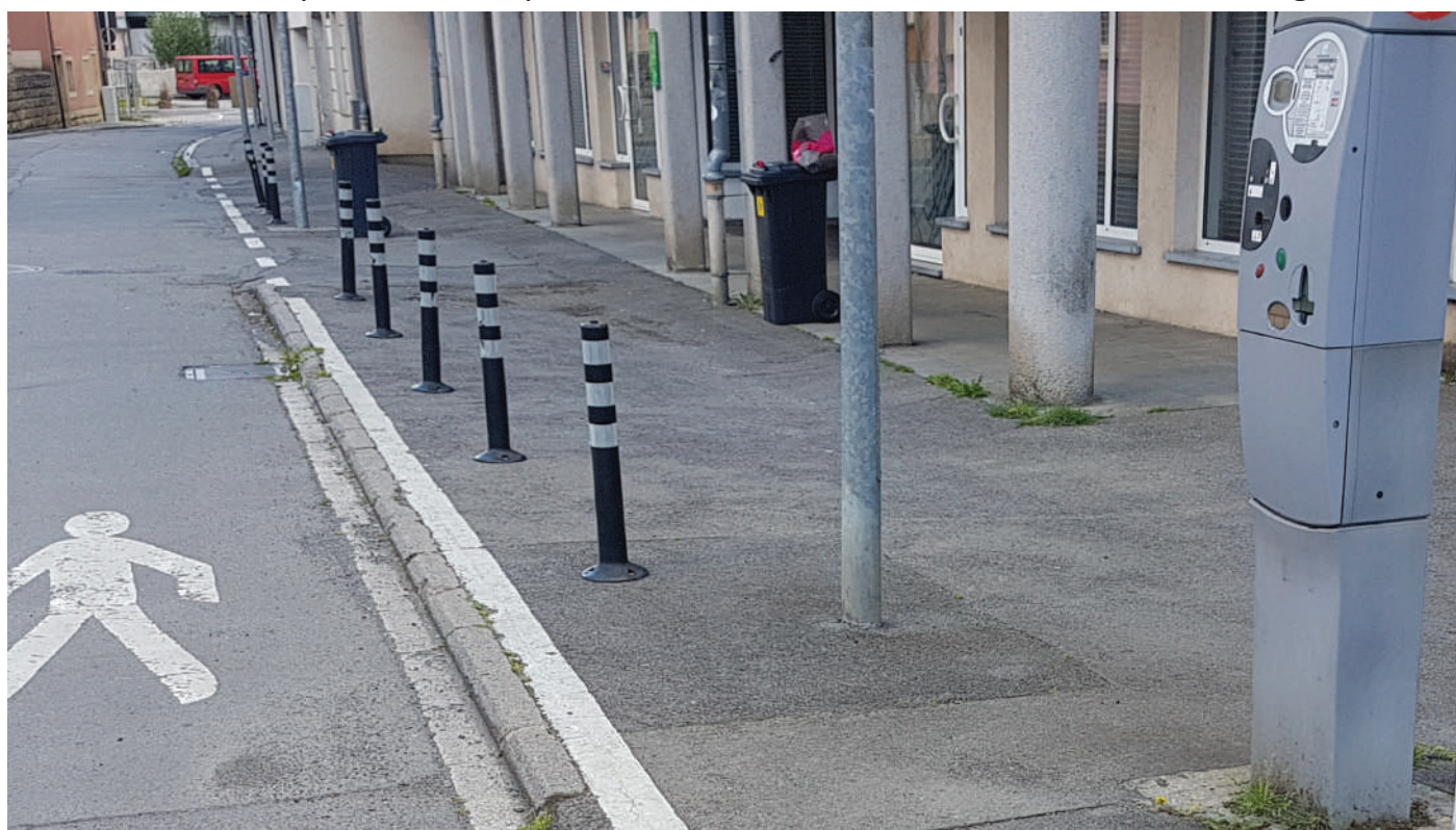
Mutwëlles verbarrikadéierte Parkraum an der Schoulstrooss, wou d'Residenten keng Platz fannen.

D'Gemeng muss Leit, déi en Auto hunn, net mutwëlles verschenkt ginn. D'Stad hëllef, an net si pisacken. Parkplazen dierf esou vill Parkraum wéi méiglech.