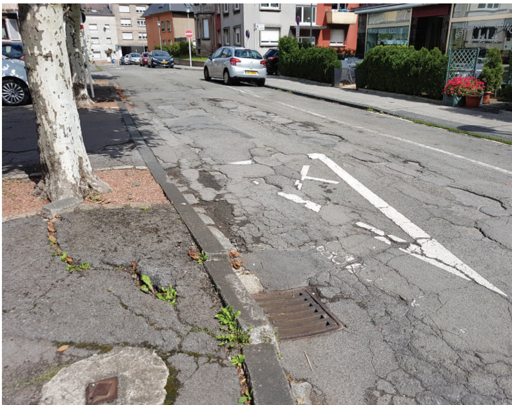
... a katastrofal Stroosseschied (hei: Mâcon-Strooss).