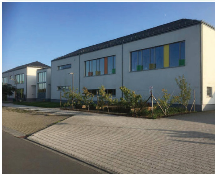
Crèche zu Reiler

D'Kanner sinn d'Zukunft vun eiser Gesellschaft. Eng optimal Betreierung an Erzéierung, déi och de neie Liewensgewunnechte gerecht gëtt, huet fir d'ADR absolut Prioritéit. D'ADR wëllt den Elteren de Choix loossen, hir Kanner selwer ze erzéien oder qualitativ héichwäerteg Strukturen ze gebrauchen. Wichteg sinn eis dobäi besonnesch och d'Problemer vun elengerzéienden Elteren.