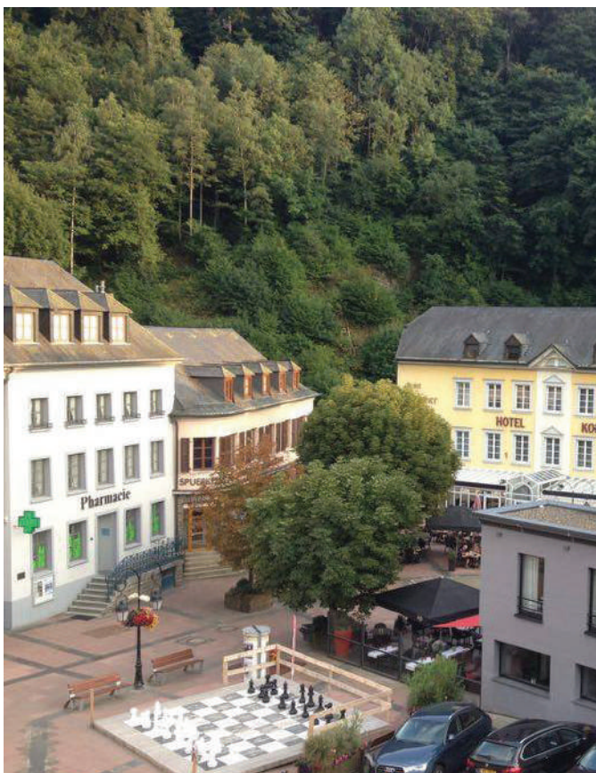
Vue op den Hotel Koener