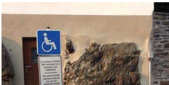
Behënnerteparking op der Clärrewer Martplatz

D'ADR wäert dofir suergen, datt eng integral behënnerten- a seniorefrëndlech Upassung vun alle Gemeindefruchten net just a Sonndesriede versprach gëtt, mee och an d'Realitéit ëmgëssat gëtt.