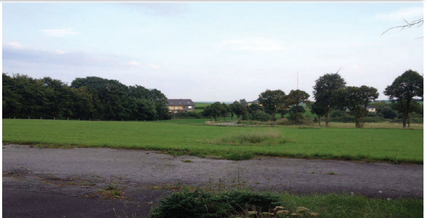
Vue op de site vun der geplangter Flüchtlingsstruktur zu Maarnech

Fir d'Integratioun vun deene Flüchtlingen, déi bleiwen däerfen, gëllt: