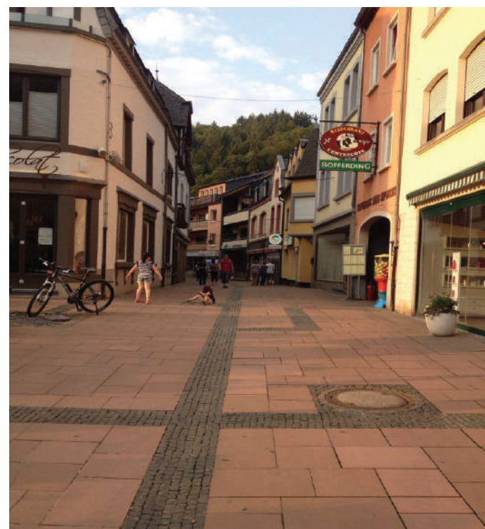
Fussgängerzone zu Clärref