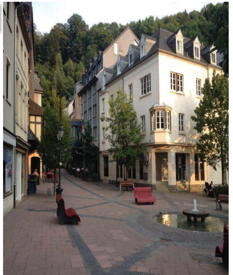
Cliärref beim Sprangbuer

All dëst si Konzepter, déi eis Gemeng endléich upacke soll. Wann een d'Kritik héiert, datt esou Projeten awer mat groussen Investitiounen verbonne sinn, muss ee bedenken, datt déi deierst Investitioun a Cliärref ass, net a Cliärref ze investéieren. D'Zäit vun de schéine Sonndesrieden ass elo riwwer. D'ADR an eiser Gemeng wäert dofir suergen, datt sënnavoll Investitiounen an d'Zukunft vun eiser Gemeng endlech zur Realitéit ginn.