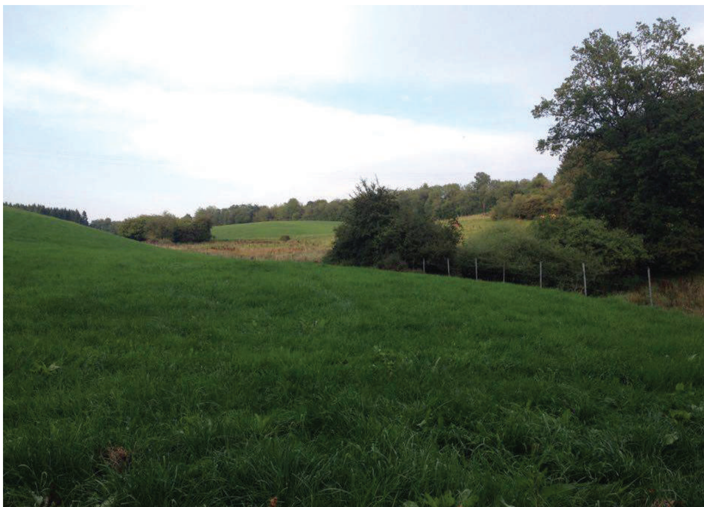
Typesch Ardenner-Landschaft an eiser Gemeng