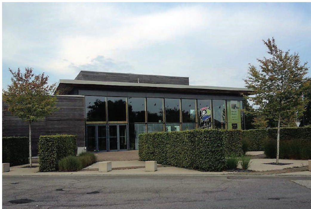
Kulturzentrum Cube 521 zu Maarnech