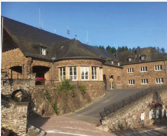
Musekschoul zu Clärref

Et leit mat an der Verantwortung vun der Gemeng, fir méiglechen Interessenten, déi esou eng Auberge bedreiwe wëllen, entgéint ze kommen. Denkbar wär hei rem d'Méiglechkeet vum symbolesche Loyer; och kann d'Gemeng selwer direkt oder indirekt esou Strukturen bedreiwen.